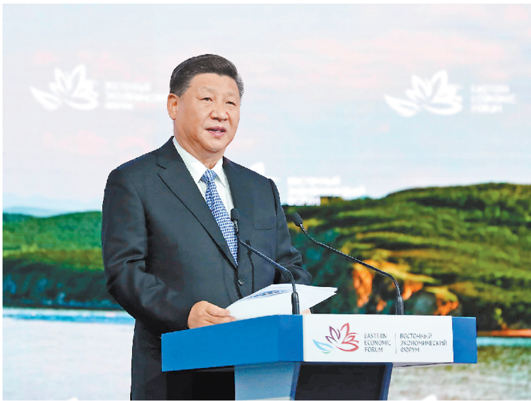
9月12日,第四届东方经济论坛全会在符拉迪沃斯托克举行。中国国家主席习近平出席并发表题为《共享远东发展新机遇 开创东北亚美好新未来》的致辞。