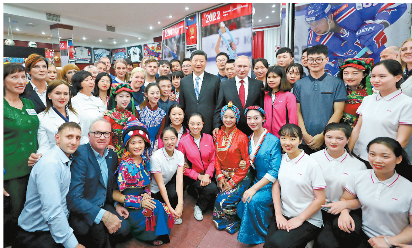
9月12日,国家主席习近平在符拉迪沃斯托克同俄罗斯总统普京一起访问“海洋”全俄儿童中心。这是习近平和普京同中俄青少年代表及中心教职工代表合影。