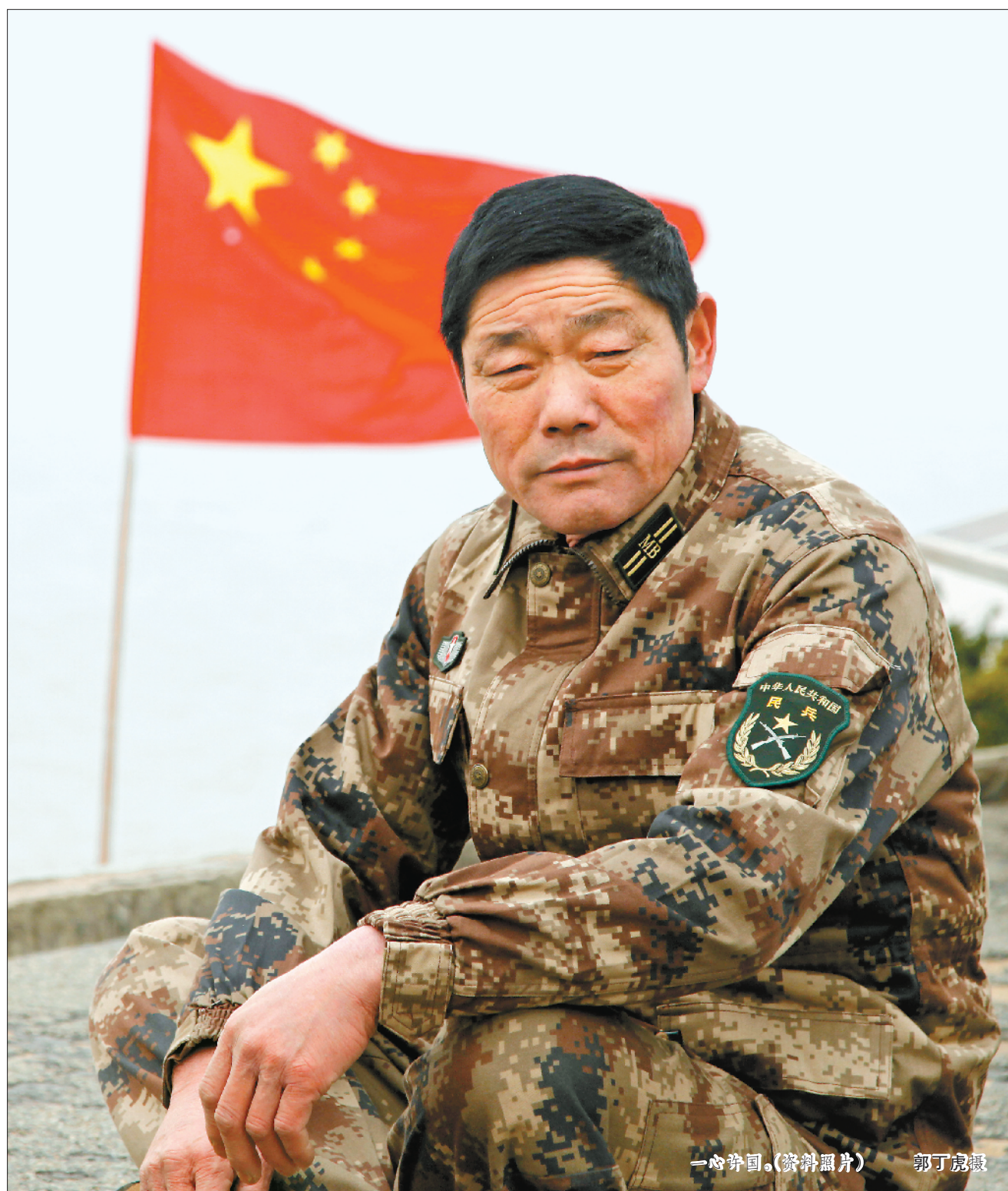
一心守国。(资料照片) 郭丁虎摄