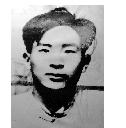
古柏像（资料照片）。

他任政治委员，率部开展游击战争。同年10月，中共寻乌县委组建，古柏任书记兼军事委员会主任委员，领导创建寻乌根据地。1930年5月，古柏协助毛泽东开展寻乌调查，毛泽东在《寻乌调查》中写道：“在全部工作上帮助我组织这个调查的，是寻乌党的书记古柏同志。”此后，古柏调到毛泽东身边工作，先后任中共第4军前委秘书长、第一方面军总前委秘书长，全力以赴协助毛泽东工作。在王明“左”倾冒险主义统治时期，古柏坚定地支持毛泽东的正确主张，因此，与邓小平、毛泽覃、谢唯俊一起受到错误批判。他坚持真理，百折不挠，始终忠实地拥护党工作。 中央红军主力长征后，古柏留下坚持斗争，任闽粤赣红军游击纵队司令。1935年2月，被派往赣南开展游击战争。3月6日在广东龙川上坪粤匪被国民党军包围，在掩护同志们突围的战斗中英勇牺牲，年仅29岁。古柏牺牲的噩耗传到延安后，毛泽东亲笔题词：“吾友古柏，英俊奋发，为国捐躯，殊堪悲悼。” “寻乌县是原中央革命根据地的重要组成部分，这块土地上的人民在历次革命斗争中作出过巨大牺牲，古柏是其中最杰出的代表。”寻乌县革命烈士纪念馆馆长何荣华说，古柏永远活在故乡人民心中。 为缅怀古柏烈士，继承发扬革命传统，1980年秋，古柏家乡人民将古柏出生地的乡镇小学命名为“古柏学校”。1984年，寻乌县革命烈士纪念馆修建古柏烈士纪念碑。 (新华社记者袁慧晶)