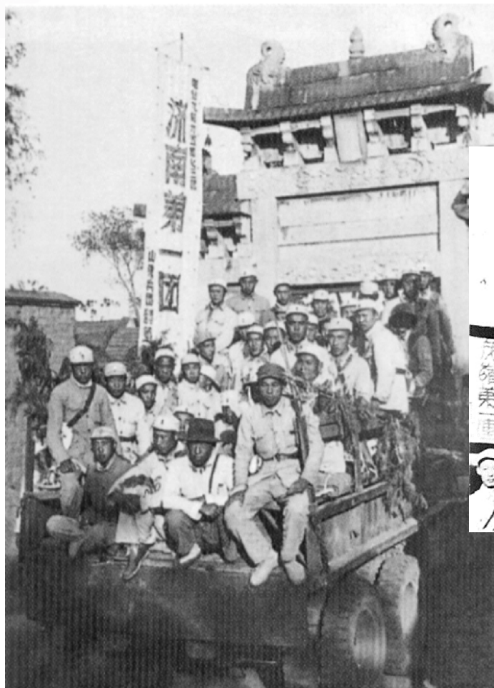
济南战役中“首战茂岭山,打开胜利门”的第9纵队指战员们。济南战役中荣获“济南第一团”称号的第73团指战员们。