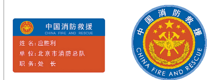
消防救援队伍干部标识牌。消防救援队伍队员标识牌。