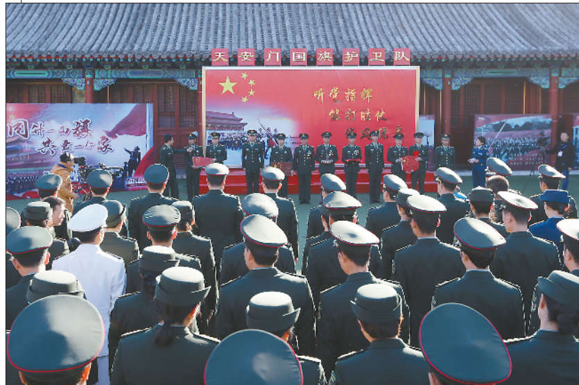
主题活动现场,边防官兵讲述国旗背后的感人故事。