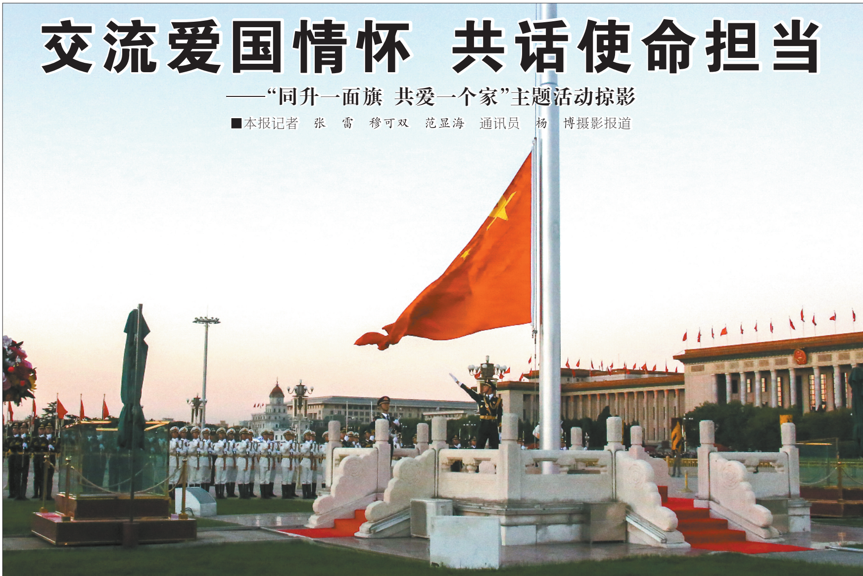
晨曦中的天安门广场庄严静穆,五星红旗冉冉升起。

活动当天,来自祖国各个方向的采访对象、特邀嘉宾带着一面面具有特殊意义的国旗汇聚在一起,与国旗护卫中队官兵一道交流爱国情怀,共话使命担当。参加活动的军事记者编辑代表表示,要努力做到政治上更强、传播上更强、影响力上更强,深入边防海岛、高原哨所等艰苦地区采访,通过笔端、镜头和话筒将基层官兵爱国奉献的事迹和精神传播得更远。