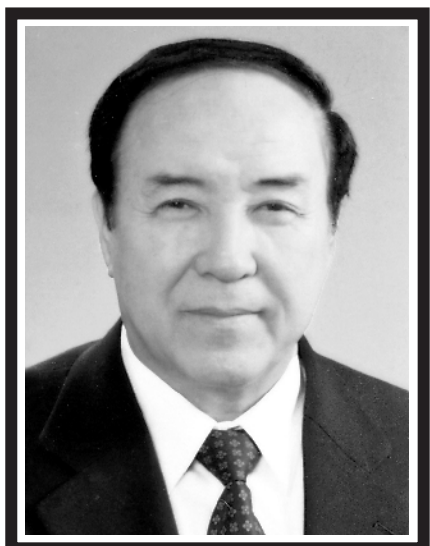
司马义·艾买提同志遗像

新华社北京10月16日电 中国共产党的优秀党员,忠诚的共产主义战士,党和国家民族工作的杰出领导人,维吾尔族的优秀儿子,中国人民政治协商会议第七届全国委员会副主席,原国务委员,第十届全国人民代表大会常务委员会副秘书长司马义·艾买提同志,因病于2018年10月16日11时58分在北京逝世,享年84岁。