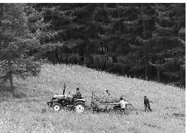
经过50多年努力，塞罕坝变成了广袤林海、减排固碳的“天然氧吧”。

改革开放的东风，激发了人们建设美丽家园的斗志。1978年，党中央、国务院决定实施“三北”防护林体系建设工程，开创我国生态工程建设先河。1998年，我国实施退耕还林等重大工程，开辟生态文明建设新战场。2003年，我国林业发展战略突出生态文明建设。2007年，党的十七大作出建设生态文明的战略部署……40年来，神州大地上每棵绿树的年轮，都见证着一场场“绿色革命”。