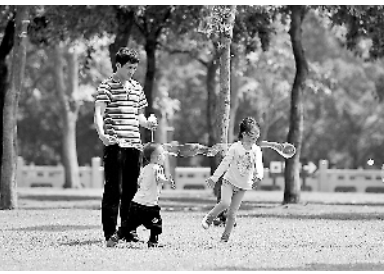
经过一番生态修复，更富风韵的海南万绿园每年都吸引很多游客。

东南沿海，深圳大鹏新区坚持绿色发展，累计淘汰转型低端企业184家。太行山麓，河北邢台前南峪村发展