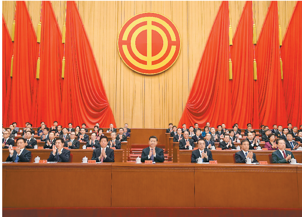
10月22日,中国工会第十七次全国代表大会在北京人民大会堂开幕。习近平、李克强、栗战书、汪洋、王沪宁、赵乐际、韩正等在主席台就座,祝贺大会召开。