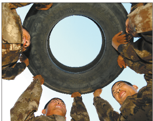
◁开展举轮胎、扛弹药箱等特色项目竞赛，提升新兵体能素质。