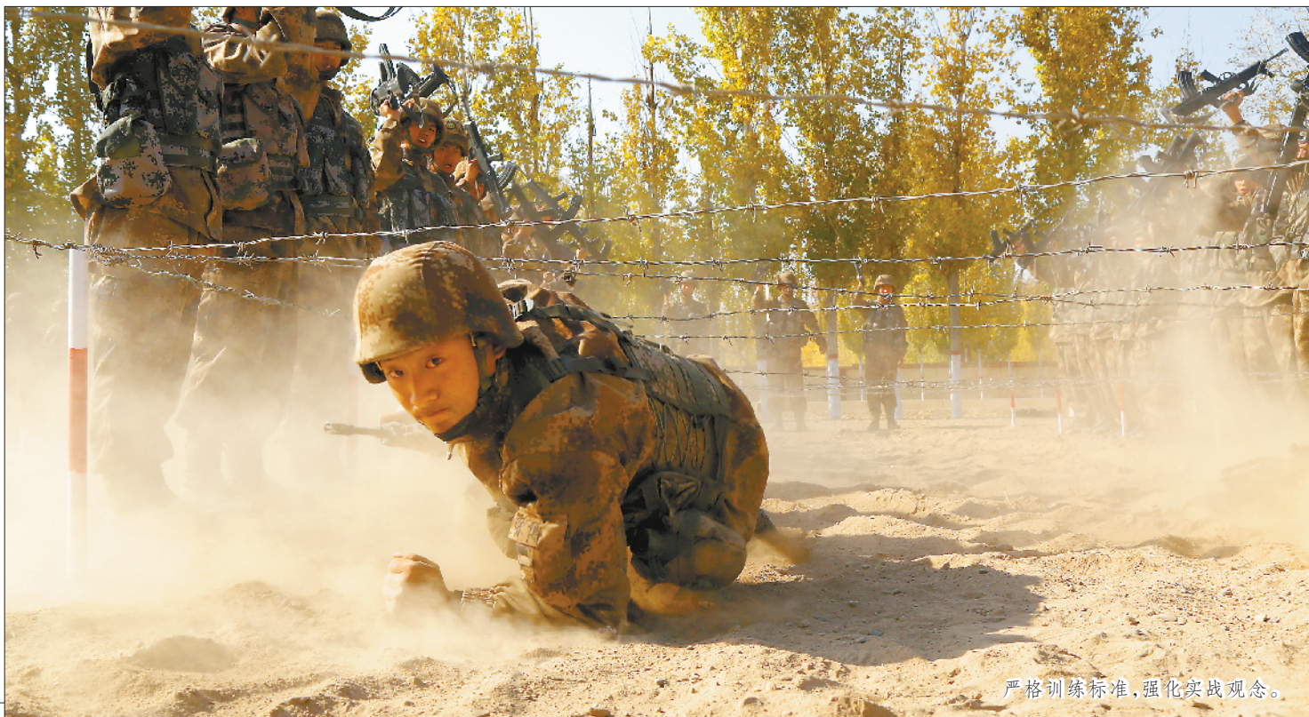
严格训练标准，强化实战观念。

10月的西北戈壁，寒意渐浓。陆军第76集团军某新兵团营区，嘹亮的呼号声打破了清晨的宁静。