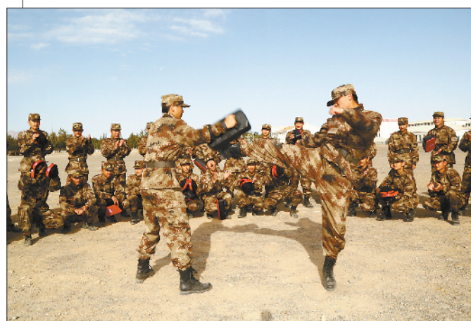
◁有武术基础的新兵，被选拔担任格斗课目教练员。