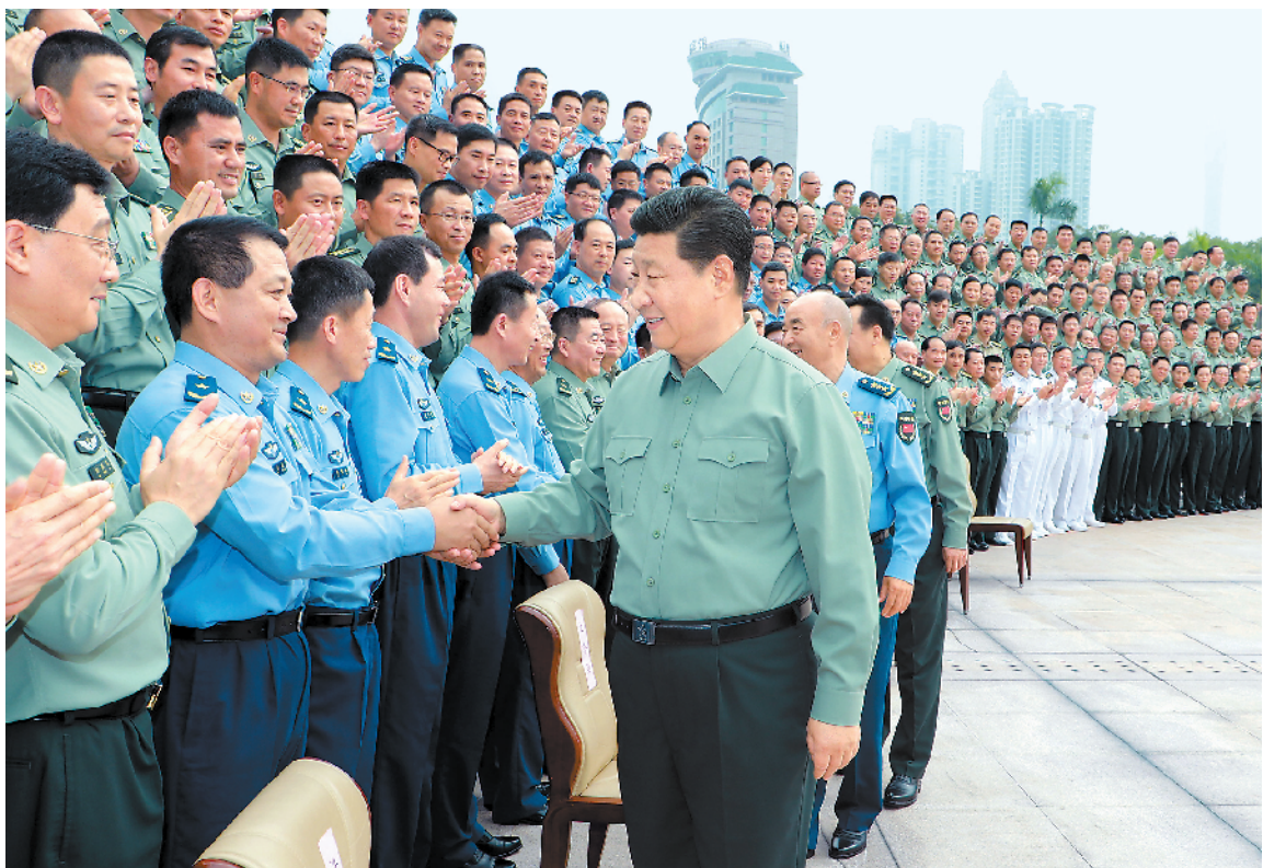
十月二十五日上午,中共中央总书记、国家主席、中央军委主席习近平到南部战区视察调研。这是习近平亲切接见驻广东部队副师职以上领导干部。

本报广州10月26日电 记者王士彬、王雁翔、特约记者李华敏报道:中共中央总书记、国家主席、中央军委主席习近平25日上午到南部战区视察调研,代表党中央和中央军委,向南部战区全体指战员致以诚挚的问候。他强调,要深入贯彻新时代党的强军思想,贯彻新形势下军事战略方针,聚焦研究打仗、指挥作战推进各项工作,加快建设坚强高效的战区联合作战指挥机构,全面提升打赢能力,坚决完成党和人民赋予的任务。