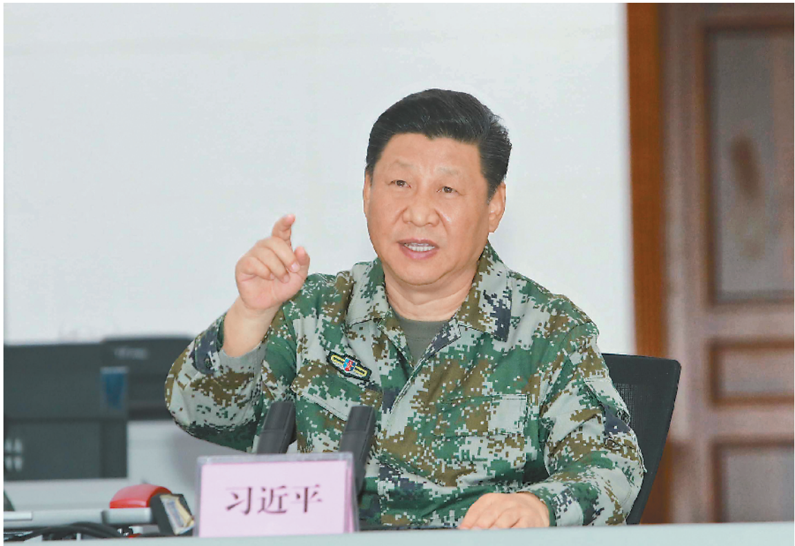
十月二十五日上午,中共中央总书记、国家主席、中央军委主席习近平到南部战区视察调研。这是习近平视察指挥大厅,实地了解战区联合作战指挥体系运行情况,勉励战区发扬改革创新精神,持续深化实践探索,加快把指挥能力搞过硬。