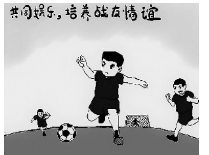
共同娱乐,培养战友情谊