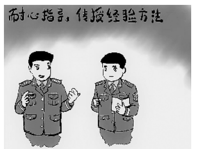
耐心指导,传授经验方法

“00后”新学员已经入学,来到军校开启自己的军旅新征程。作为队干部,是在为怎么与他们相处、如何走进他们的世界而发愁呢?别急,这就给你支几招。