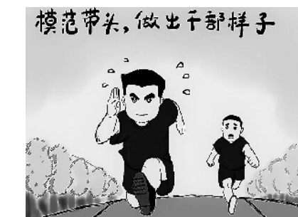
模范带头,做出干部样子