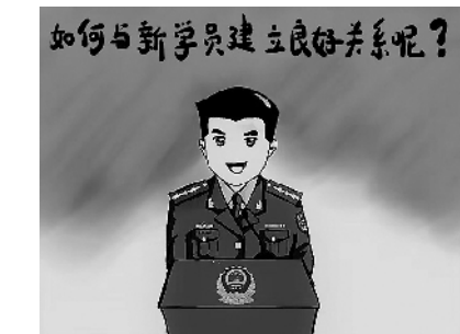
如何与新学员建立良好关系呢?