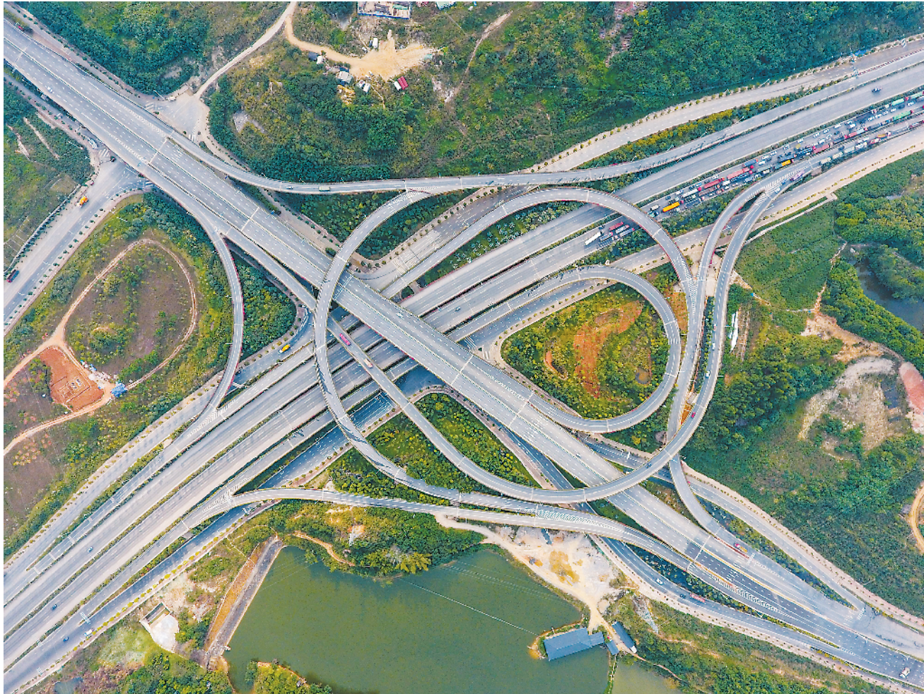
近年来,广西在海、陆、空立体式推进与东盟国家的互联互通,扎实推进“高速县县通、高铁市市通、民航片片通、内河条条通”建设。目前高铁运营里程1751公里,高速公路总里程突破5000公里,机场旅客年吞吐能力近3000万人次。图为广西南宁市的一座立交桥(11月10日无人机拍摄)。

■当地时间12日下午,应新加坡共和国总理李显龙邀请,李克强乘专机抵达新加坡,开始对新加坡进行正式访问,并将出席第21次中国-东盟(10+1)领导人会议、第21次东盟与中日韩(10+3)领导人会议和第13届东亚峰会 ■李克强当地时间12日在新加坡总统府同新加坡总理李显龙举行会谈时强调,加强创新引领,打造合作新亮点,推动中新与时俱进的全方位合作伙伴关系迈上新台阶 ■王岐山12日在京会见校长里夫率领的麻省理工学院理事会执委会成员 (均据新华社)