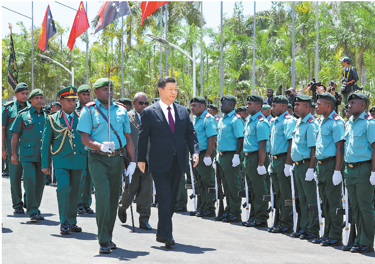
11月16日,国家主席习近平在莫尔兹比港会见巴布亚新几内亚总督达达埃。会见开始前,达达埃在议会大厦前广场为习近平举行隆重欢迎仪式。