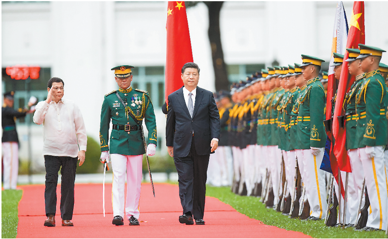
11月20日,国家主席习近平在菲律宾总统府前草坪举行隆重欢迎仪式。这是习近平在杜特尔特陪同下沿红地毯检阅仪仗队。