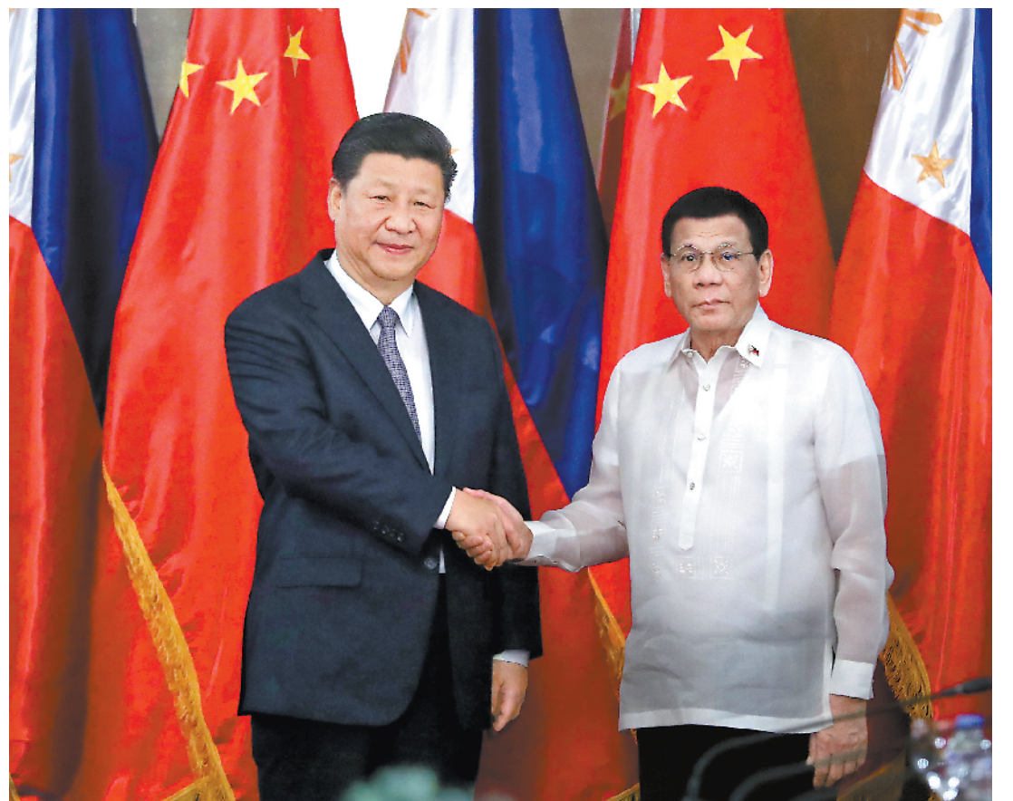
11月20日,国家主席习近平在菲律宾总统府前草坪举行会谈。

这是中国国家主席13年来首次到访,具有历史性意义,是两国关系的重要里程碑,将掀开两国伙伴合作的新篇章。菲方祝贺中国改革发展40年取得的成就,相信中国人民一定可以实现“两个一百年”的奋斗目标。菲方愿继续在相互尊重、相互理解、主权平等的基础上同中方深化全面战略合作关系,加强贸易、投资、农业、防务、卫生、禁毒、改善民生、基础设施建设和能源等领域合作,扩大教育、人力资源等人文交流。菲方赞同本地区国家共同维护南海和平稳定,愿积极促进东盟同中国关系发展。在处理国际事务中,中国是站在历史正确一边。菲方愿密切同中方在联合国等多边框架内沟通协调。 会谈后,两国元首共同见证了《中华人民共和国政府与菲律宾共和国政府关于共同推进“一带一路”建设的谅解备忘录》、《中华人民共和国政府与菲律宾共和国政府关于油气开发合作的谅解备忘录》等多项双边合作文件的签署。 两国元首共同会见了记者。 会谈开始前,习近平出席杜特尔特在总统府前草坪举行的隆重欢迎仪式。 马尼拉椰风摇曳,海风拂面。总统府外,高高悬挂着中菲两国国旗。道路两旁,千名当地少年儿童挥舞着两国国旗,向习近平热情欢呼。一张张天真烂漫的笑脸,洋溢着对中菲关系美好未来的期盼。 菲律宾总统府充满庄重、隆重、热烈的气氛。当地时间下午4时40分许,习近平乘专机抵达总统府,受到杜特尔特热情迎接。两国元首登上检阅台。仪仗队行持枪礼。鼓手敲起激昂的鼓点,号手吹响迎宾的号声。军乐队奏中菲两国国歌。现场鸣放21响礼炮。习近平在杜特尔特陪同下沿红地毯检阅仪仗队。检阅毕,习近平同菲方主要官员握手,杜特尔特同中方陪同人员握手。两国元首共同前往总统府主楼。沿途,当地艺术家伴着菲律宾传统竹管弦乐翩翩起舞,悠扬的乐声、曼妙的舞姿吸引两国元首不时驻足欣赏。 丁薛祥、杨洁篪、王毅、何立峰等出席上述活动。 当天下午,习近平还向菲律宾国父黎刹纪念碑敬献花圈。