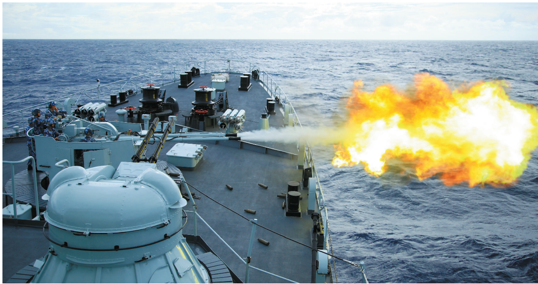
郑和舰是中国海军指挥人才的摇篮。3万多名学员在郑和舰“淬火”后走向深蓝大洋。