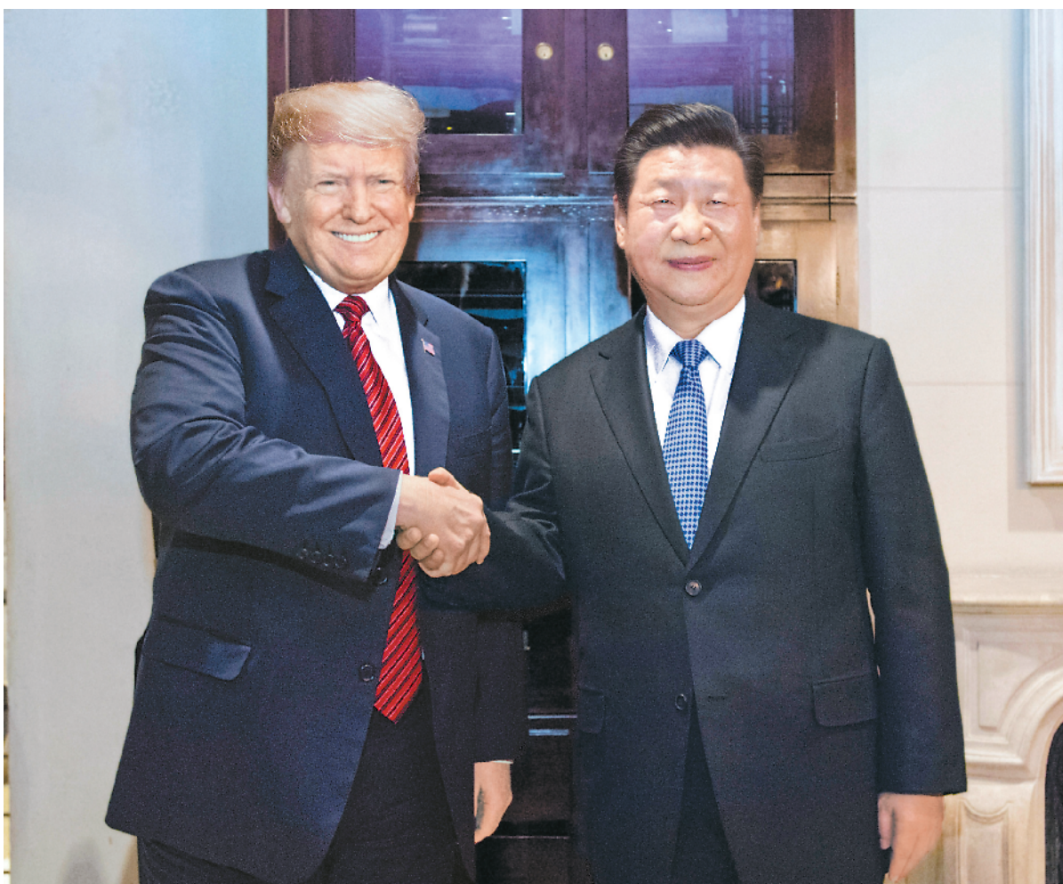
当地时间十二月一日,国家主席习近平应邀同美国总统特朗普在阿根廷布宜诺斯艾利斯共进晚餐,举行会晤。