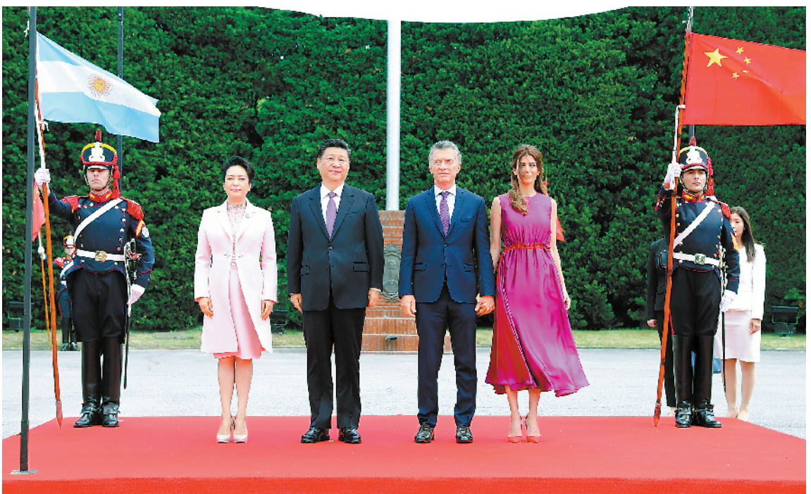
当地时间十二月二日,国家主席习近平同阿根廷总统马克里在布宜诺斯艾利斯举行会谈。会谈前,马克里在总统官邸荣誉广场为习近平举行隆重欢迎仪式。这是习近平和夫人彭丽媛同马克里和夫人阿瓦达在欢迎仪式上。

新华社布宜诺斯艾利斯12月2日电 (记者陈茂、霍小光、王海清)当地时间12月2日,国家主席习近平同阿根廷总统马克里在布宜诺斯艾利斯举行会谈。两国元首一致同意,以更加广阔视野谋划两国关系发展蓝图,携手开创中阿全面战略伙伴关系新时代。 习近平指出,2年多来,我同总统先生5次会晤,创造了中阿关系史上的新纪录。中阿合作的广度和深度前所未有。当前,国际形势复杂多变。面对新形势、新挑战,双方要在相互尊重、平等互利、合作共赢基础上,以更宽广的视野来规划双边关系,做深做实各领域合作,开创中阿全面战略伙伴关系新时代,为两国和世界和平、稳定、繁荣作出新贡献。 习近平指出,双方要继续在涉及彼此核心利益问题上相互支持,坚定不移支持对方自主选择的发展道路。今年以来,阿根廷经济金融形势出现波动。中方以实际行动支持阿方维护本国金融稳定的努力,对阿根廷发展前景充满信心,对中阿合作充满期待。双方要以未来5年两国政府共同行动计划为纲领,在共建“一带一路”框架内加强沟通和合作,对接两国发展规划,统筹推进各层次各领域交流合作。中方愿扩大进口阿根廷优质产品和服务,促进双边贸易便利化。中方支持阿方能源多元化战略,愿同阿方执行好能源领域“旗舰”项目。中方愿积极参与阿方基础设施建设、民生等项目,促进阿根廷和南美地区互联互通。要深化投融资和本币互换合作,支持改革和完善国际货币体系,共同提升新兴经济体和发展中国家在国际经济金融机构中的发言权和代表性。要推进青年交流,加强文化、教育、旅游、体育等领域合作,增进两国人民相互了解和友好感情。 习近平指出,中阿同为具有重要影响的发展中国家和新兴市场国家,应该