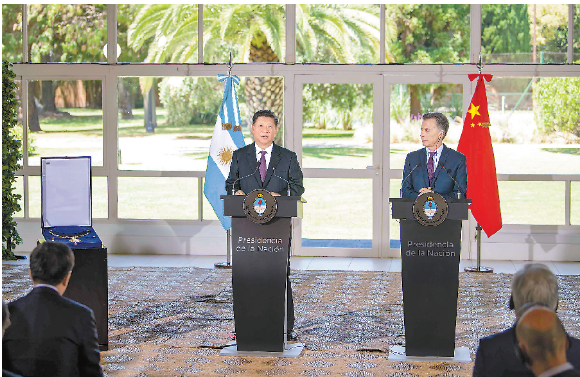
当地时间十二月二日,国家主席习近平在布宜诺斯艾利斯接受阿根廷总统马克里授予的“解放者圣马丁大项链级勋章”。

新华社布宜诺斯艾利斯12月2日电 (记者骆璐)当地时间12月2日,国家主席习近平在布宜诺斯艾利斯接受阿根廷总统马克里授予的“解放者圣马丁大项链级勋章”。 授勋仪式在总统官邸举行。司仪宣读《行政令》后,马克里向习近平授予“解放者圣马丁大项链级勋章”。这枚勋章以阿根廷国父圣马丁命名,是阿根廷政府授予外国公民的最高荣誉,由国家元首亲自颁授。 马克里在致辞中赞扬中国在习近平领导下取得的巨大发展成就,高度评价阿中关系以及中国为维护世界和平、促进共同发展作出的重要贡献。 习近平在致辞中表示,马克里总统授予我“解放者圣马丁大项链级勋章”,我感到十分荣幸。这枚勋章象征着阿根廷人民追求独立自主的民族精神,承载着阿根廷对中国人民的深情厚谊。这份荣誉不仅属于我个人,也属于所有为中阿友谊耕耘付出的友好人士。我将永远珍藏这份美好情谊。 丁薛祥、杨洁篪、王毅、何立峰等参加上述活动。