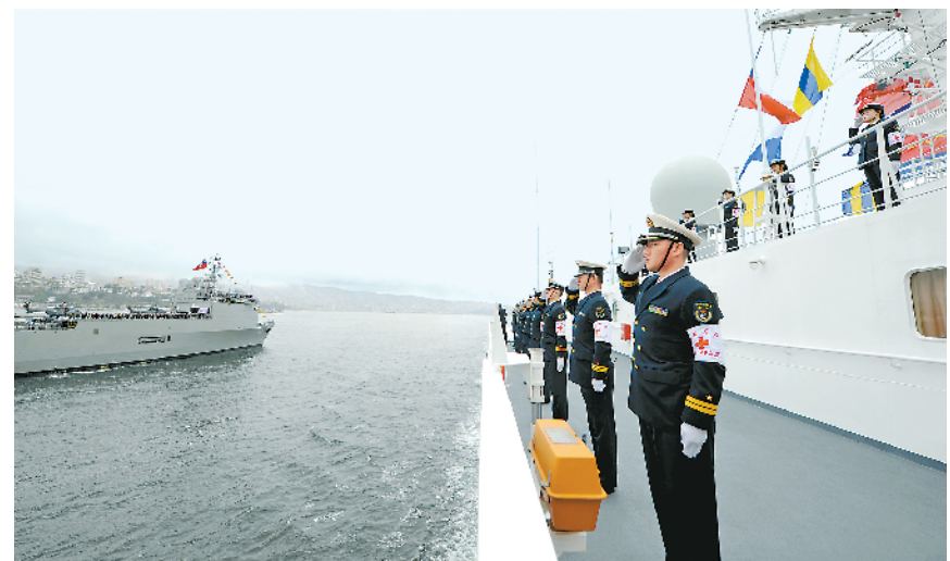
当地时间12月2日，智利海军在瓦尔帕莱索港举行成立200周年国际海军阅兵式活动，来自智利、中国、美国、英国等国的24艘水面舰艇、2艘潜艇和15架飞机参加。图为中国海军和平方舟医院船通过检阅舰——智利海军阿尔戴尔号坦克登陆舰时，官兵行举手礼。

世界知识产权组织总干事弗朗西斯·高锐表示，“在短短几十年中，中国从无到有建立了知识产权制度，鼓励本土创新，并加入了全球知识产权引领者的行列，如今正在推动全球知识产权申请的增长。”