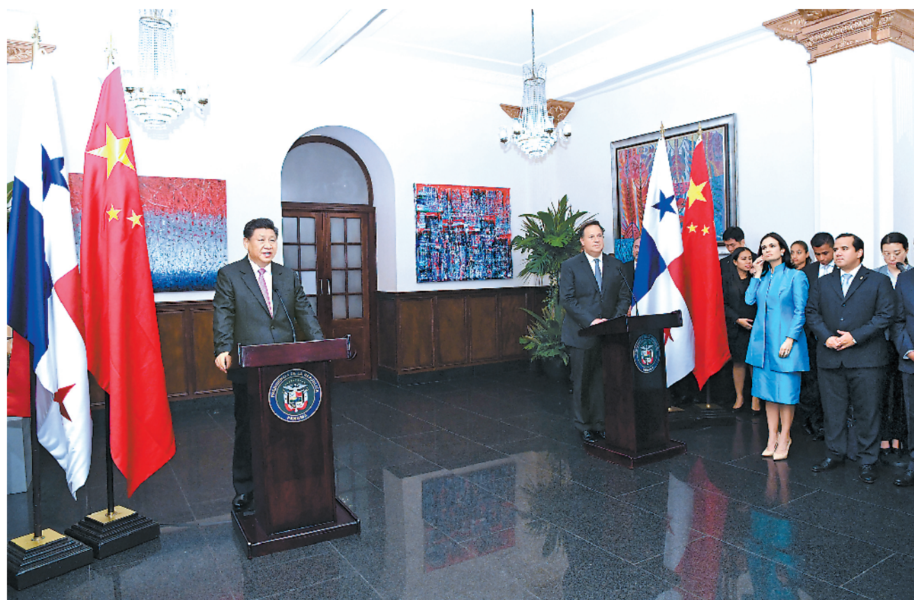
当地时间12月3日，国家主席习近平在巴拿马城和巴拿马总统巴雷拉共同会见出席中国-巴拿马经贸合作论坛的双方企业家代表。