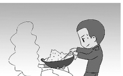
5.再为战友们炒一桌菜,相信自己带出来的故事员也能让大家吃得开心。