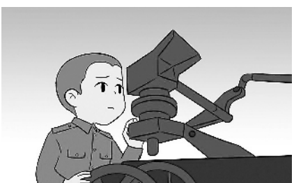
3.再操作一次武器装备,感谢这无声的“老伙计”多年陪伴。