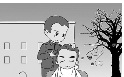
4.再为战友理一次发,班长走后你们也要像班长一样扛起责任。