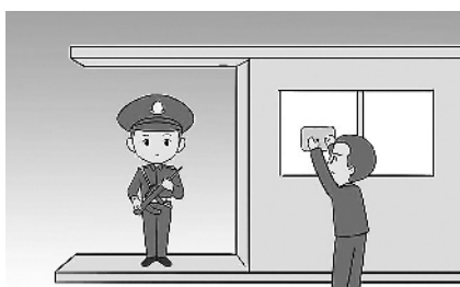
1.再维护一次熟悉的哨位,回忆无数个坚守岗位的夜晚。