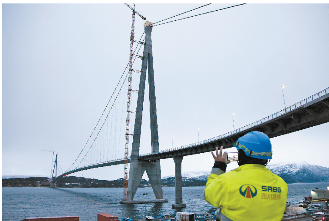
12月9日，由中国四川路桥建设集团承建的挪威第二大桥梁哈罗德大桥通车典礼举行。这座大桥位于挪威北部港口城市纳尔维克附近，桥长1533米，是北极圈内最大跨径悬索桥。图为一名中国工人拍摄哈罗德大桥。

国防大学国际防务学院院长徐辉介绍说，这次研讨会旨在充分利用学院这个全军乃至全国最高级国际军事教育和交流平台，从全球视野共同回顾改革开放40年所走过的道路、取得的成就以及对世界和平发展的贡献，分析研究深化改革开放面临的机遇和挑战，并对未来人类命运共同体建设提出意见和建议。