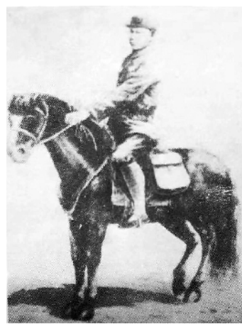
徐秋烈士像(资料照片)。

同年9月，根据地派南下干部途经郛城，徐秋主动担负起境内护送任务。此后在赵楼受到敌人包围，徐秋探知敌人兵力过多，如硬打硬拼，势必造成更大损失。在这种敌我力量悬殊的危险关头，决定突围。他先命魏振方带一个连，从赵楼西边渡河突围成功。为了保护南下干部的安全，徐