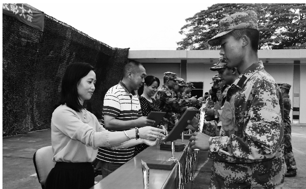
12月5日，第74集团军某新兵旅按照新条令中“举行授奖仪式，可以邀请军人亲属参加”规定，邀请部分新兵家长参加群众性练兵比武活动颁奖仪式，激发了新战士的荣誉感和练兵热情。

素质是最硬的通行证。该旅政委陈永峰感慨地说，旅党委从官兵最关心的敏感问题入手，让权力在阳光下运行，汇聚了团结向上的军心士气，形成了风清气正的干事氛围。