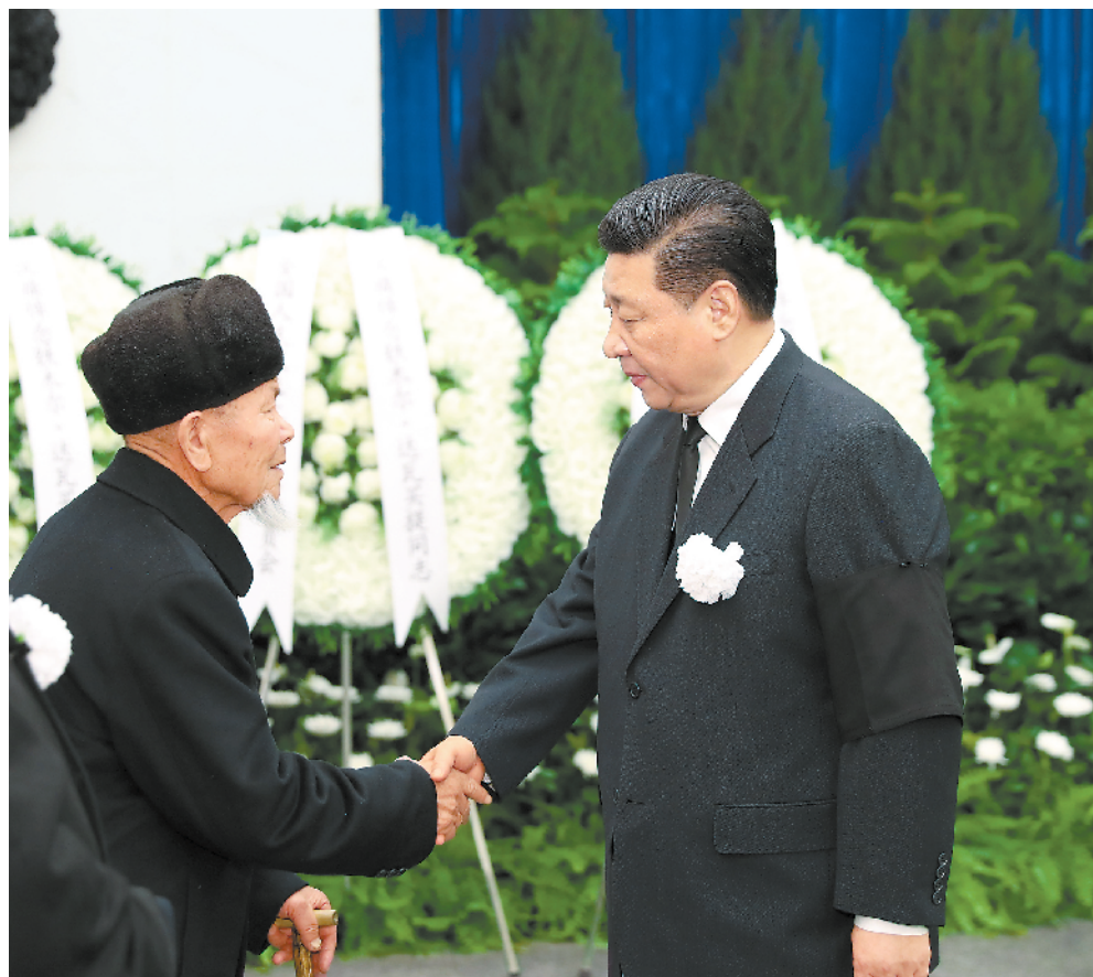
12月21日,铁木尔·达瓦买提同志遗体送别在北京八宝山革命公墓举行。习近平、李克强、栗战书、汪洋、王沪宁、赵乐际、韩正、王岐山等前往八宝山送别。这是习近平与铁木尔·达瓦买提亲属握手,表示深切慰问。新华社记者 黄敬文摄

铁木尔·达瓦买提同志病重期间和逝世后,习近平李克强栗战书汪洋王沪宁赵乐际韩正王岐山江泽民胡锦涛等同志,前往医院看望或通过多种形式对铁木尔·达瓦买提同志逝世表示沉痛哀悼并向其亲属表示深切慰问