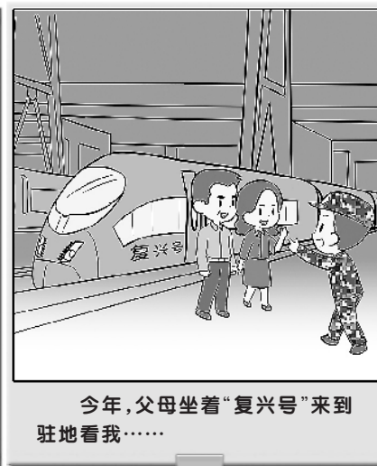
今年,父母坐着“复兴号”来到驻地看我……