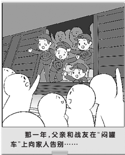
那一年,父亲和战友在“闷罐车”上向家人告别……