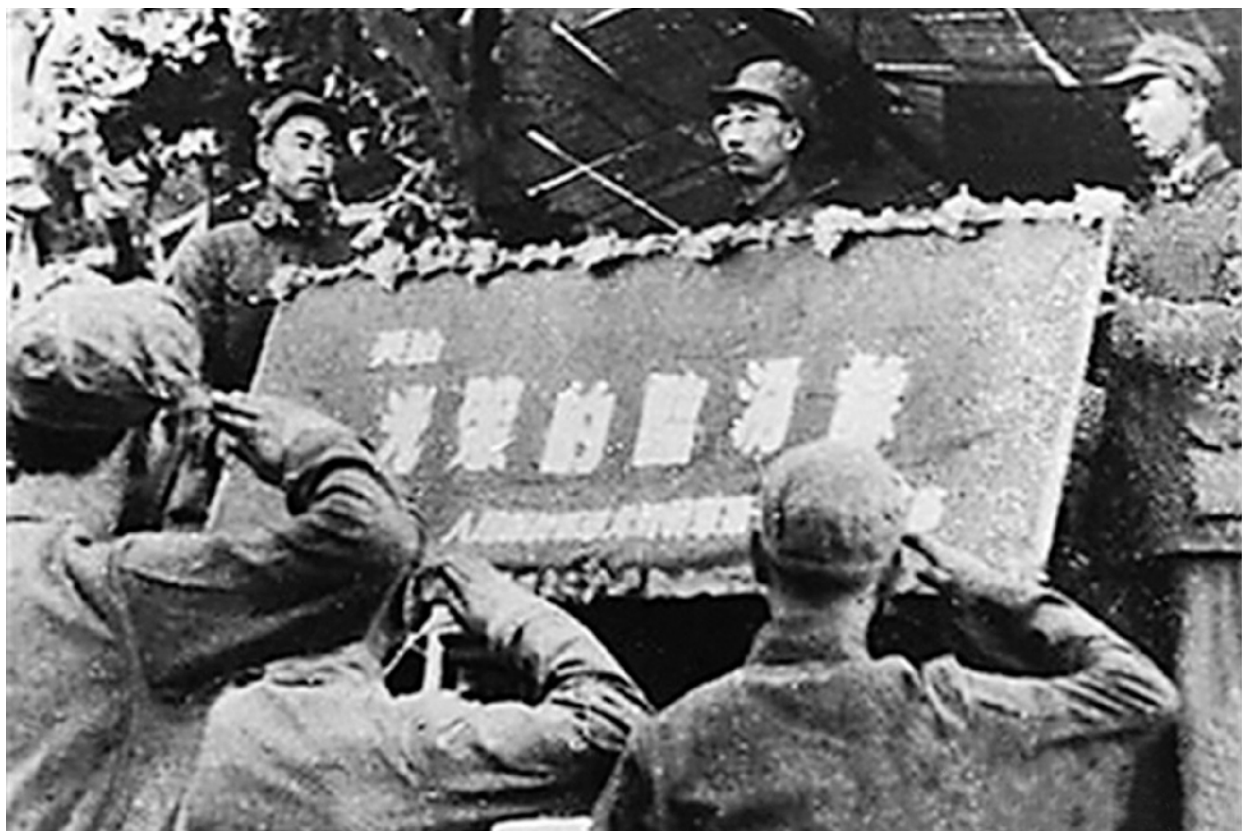
临汾战役胜利后，第23旅被授予“光荣的临汾旅”荣誉锦旗。