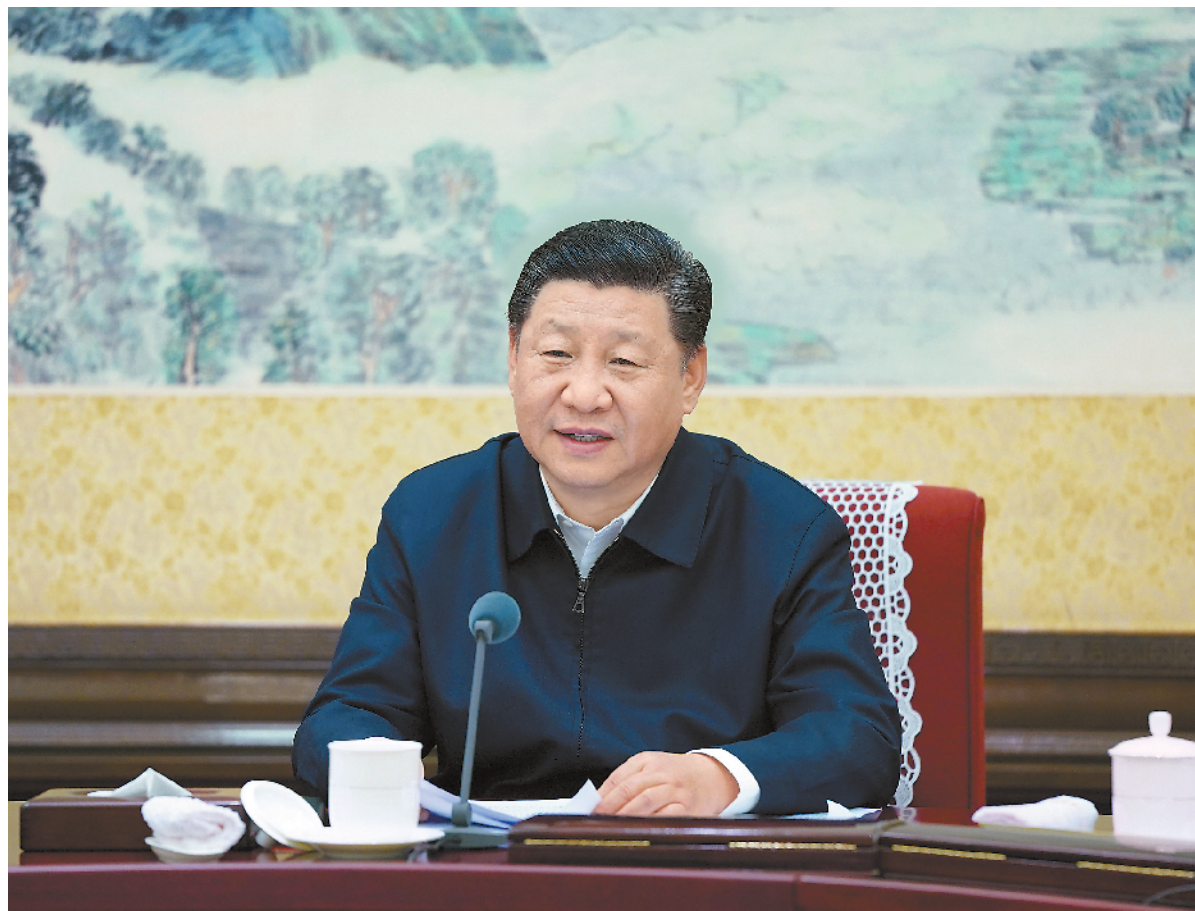
12月25日至26日,中共中央政治局召开民主生活会,中共中央总书记习近平主持会议并发表重要讲话。