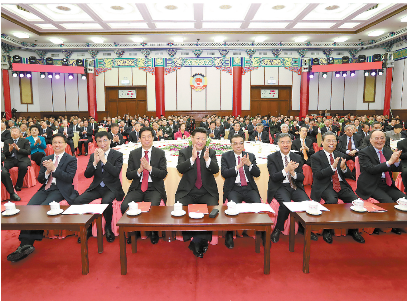
12月29日,全国政协在北京举行新年茶话会。党和国家领导人习近平、李克强、栗战书、汪洋、王沪宁、赵乐际、韩正、王岐山出席茶话会并观看演出。

新华社北京12月29日电 中国人民政治协商会议全国委员会12月29日上午在全国政协礼堂举行新年茶话会。党和国家领导人习近平、李克强、栗战书、汪洋、王沪宁、赵乐际、韩正、王岐山等同各民主党派中央、全国工商联负责人和无党派人士代表、中央和国家机关有关方面负责人以及首都各族各界人士代表欢聚一堂,喜迎2019年元旦。 中共中央总书记、国家主席、中央军委主席习近平在茶话会上发表重要讲话。他强调,2019年是新中国成立70周年,是决胜全面建成小康社会关键之年。我们要崇尚学习、加强学习,崇尚创新、勇于创新,崇尚团结、增进团结,既