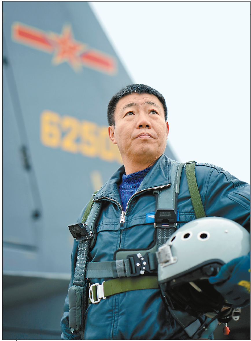
郝井文的目标是决胜万里长空。