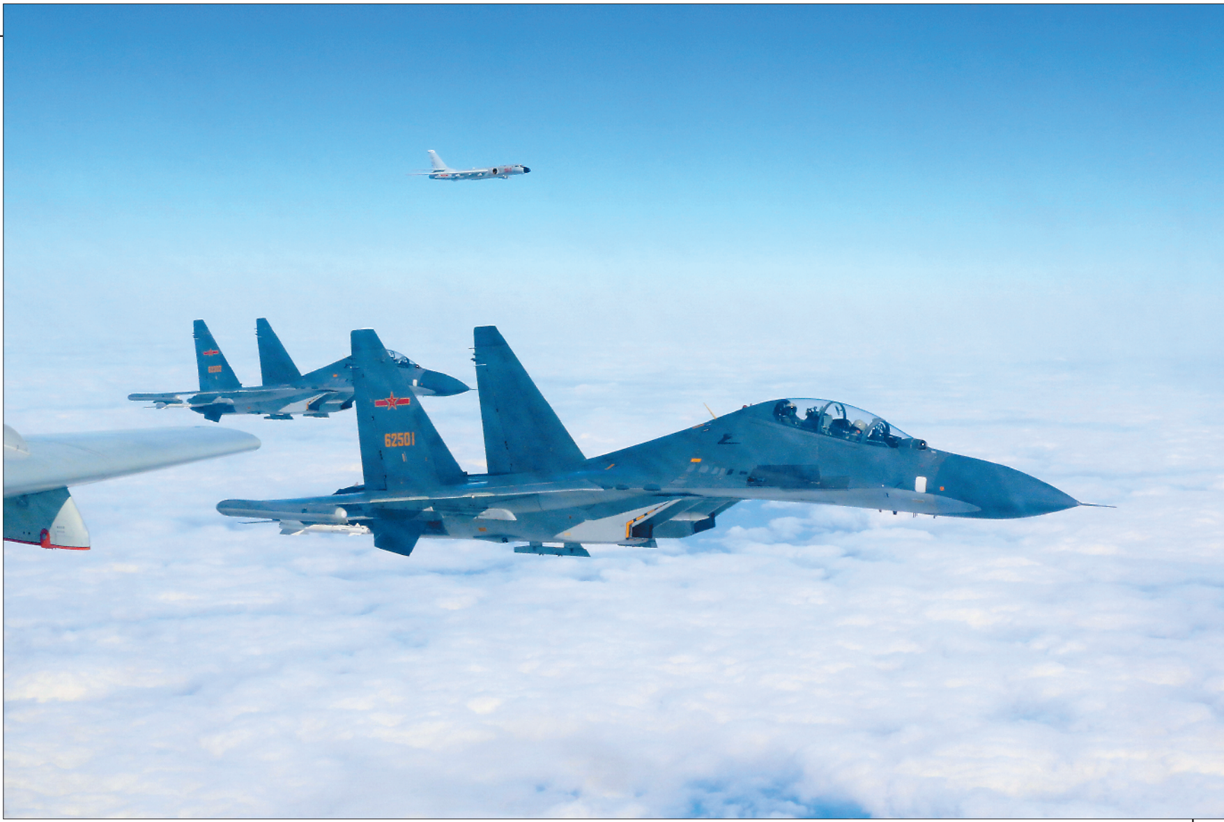
郝井文带领歼击机编队参加空军体系远洋训练。