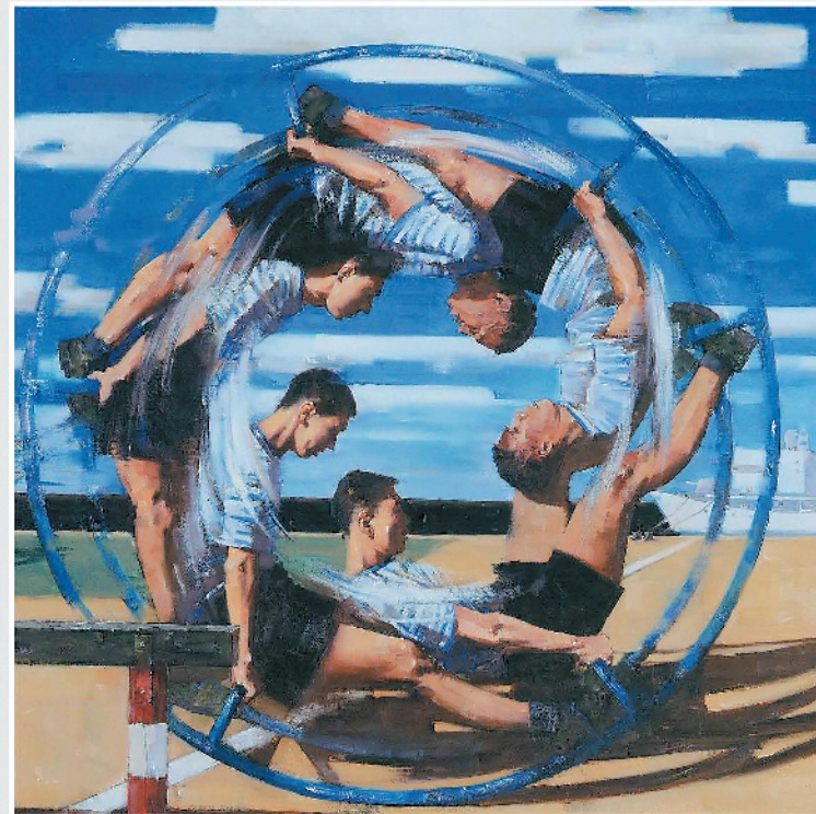
《风》油画 170cm × 170cm 郑明阳 杨大为