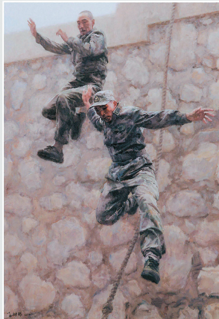
《下》油画 165cm × 115cm 王树鹏