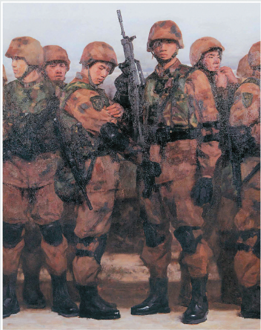
《待命》油画 200cm × 160cm 张逸伦 赵光明