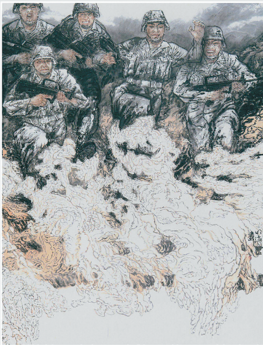
《淬火》国画 240cm × 180cm 刘明海