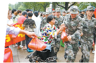
MARK·不拿群众一针一线

陆军勤务学院组织野营拉练途中，偶遇一群放学归来的小学生。一个男孩突然立正站好，向解放军叔叔敬上一个军礼。