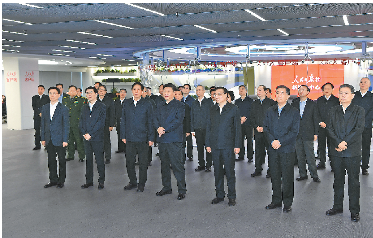
1月25日,中共中央政治局在人民日报社就全媒体时代和媒体融合发展举行第十二次集体学习。这是习近平、李克强、栗战书、汪洋、王沪宁、赵乐际、韩正等在人民日报新媒体中心听取报社微博、微信、客户端建设情况汇报,并观看新媒体产品展示。