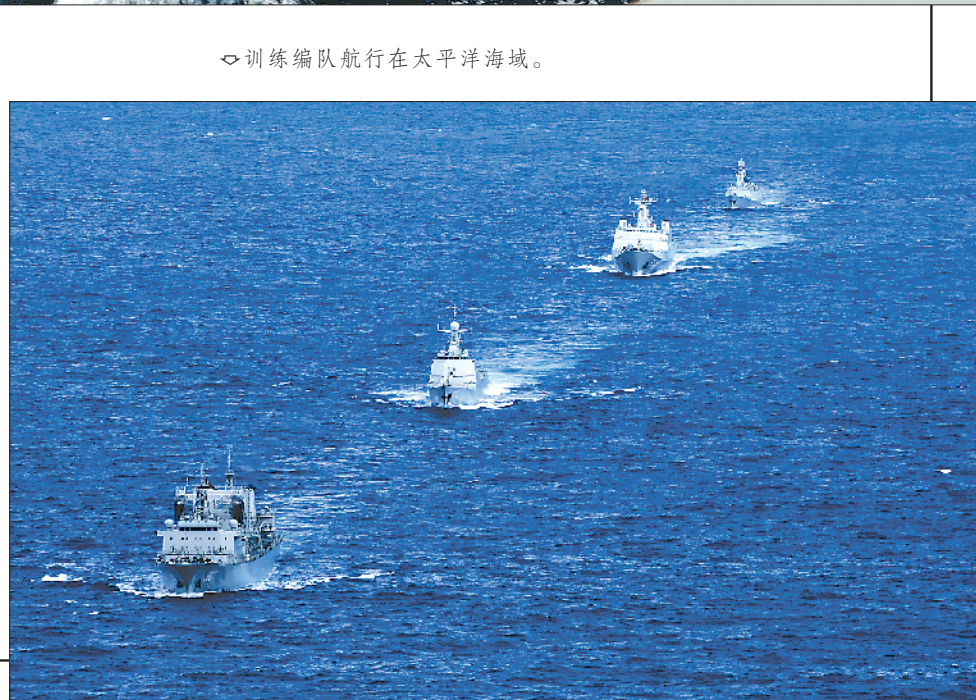
◁ 训练编队航行在大洋海域。