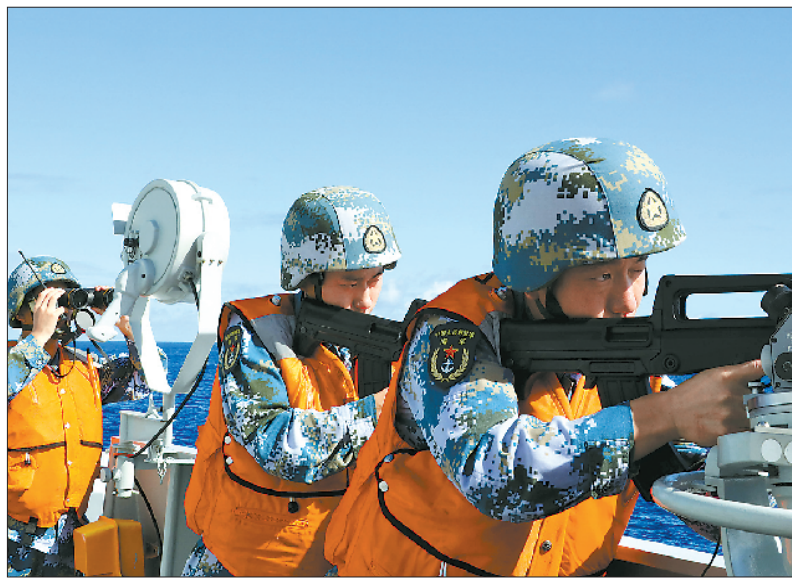
◁ 武装营救演练中,火力组严阵以待。