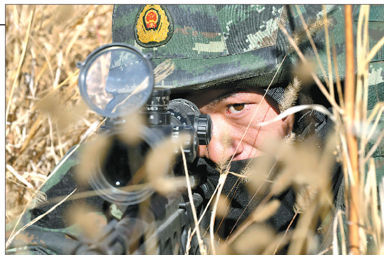
◁ 特战队员对“恐怖分子”实施围捕。