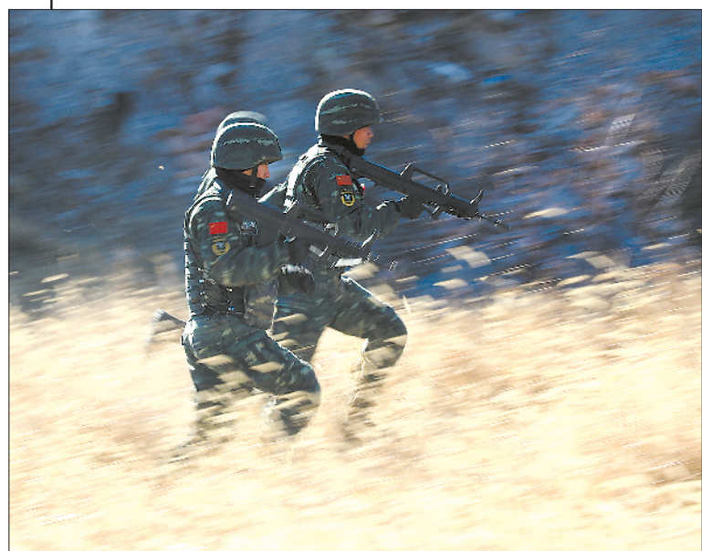
◁ 负重武装奔袭,挑战体能极限。