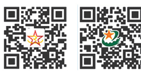
制图：于美玉、吕欣彤