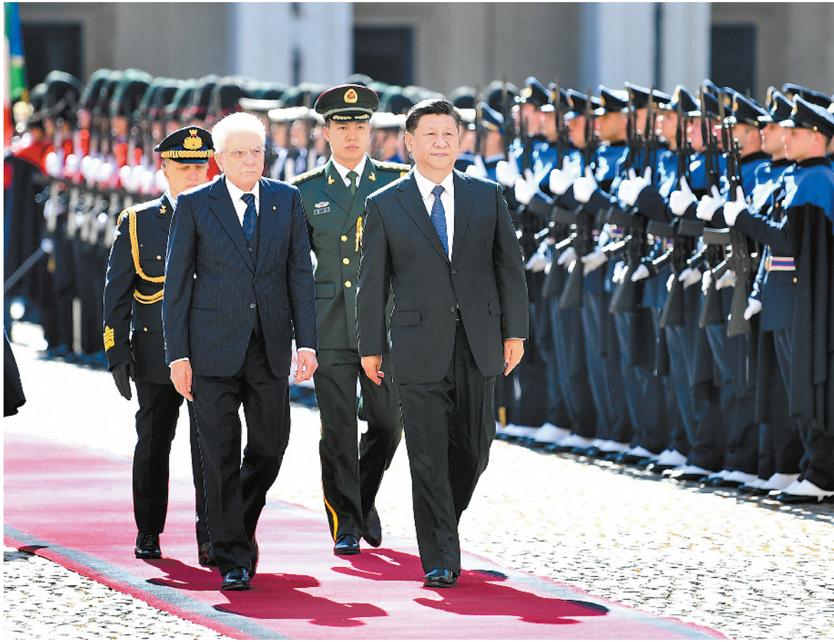
3月22日,国家主席习近平在罗马同意大利总统马塔雷拉举行会谈。会谈前,马塔雷拉总统为习近平举行隆重欢迎仪式。