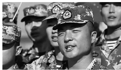
驻三沙官兵参加《我和我的祖国》快闪活动，表达对祖国的眷眷之情。

在祖国最南端的海南省三沙市，“我和我的祖国”快闪活动不仅展现着伟大祖国的繁荣富强，还彰显着海岛军人的奉献精神。