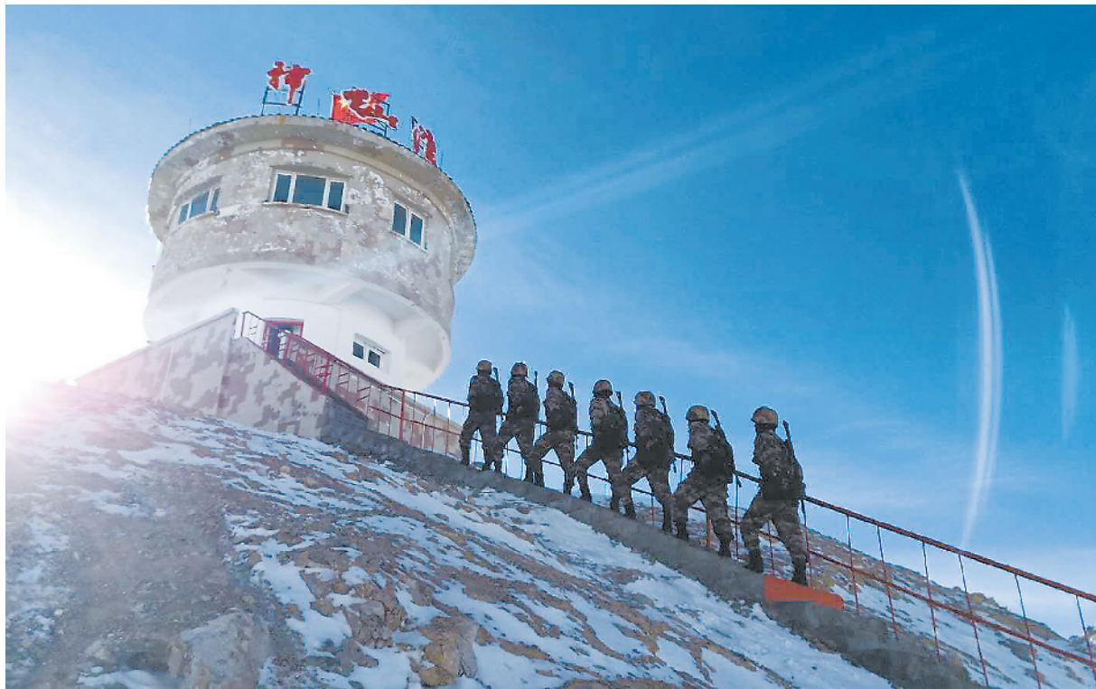
喀喇昆仑精神激励一代代官兵扎根高原边关无私奉献。图为神仙湾边防连官兵走向岗位。