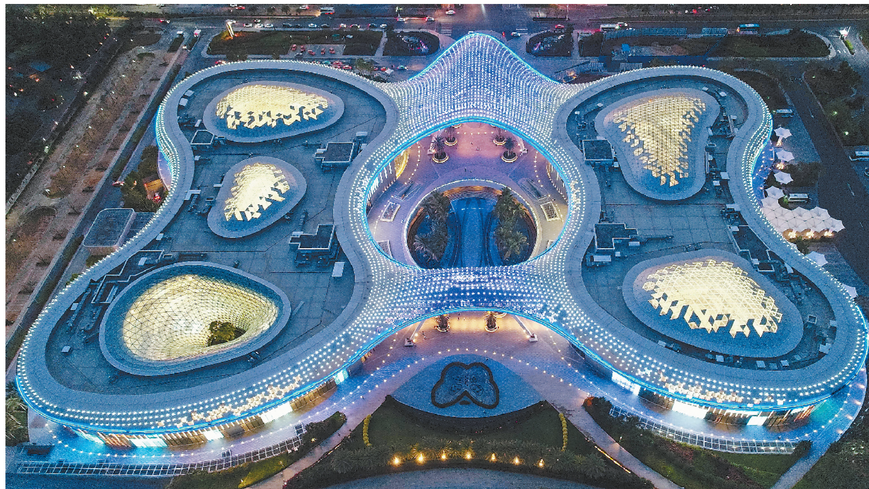
日前，海南省委通过了《中共海南省委关于高标准高质量建设全岛自由贸易试验区为建设中国特色自由贸易港打下坚实基础的意见》，以更加积极主动的姿态，推进全面开放高质量新格局的加快形成。图为位于海南省三亚市海棠湾的三亚国际免税城夜景。