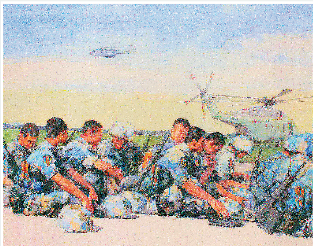
《待命》水彩画 崔风东 吴跃胜 郭荣钧