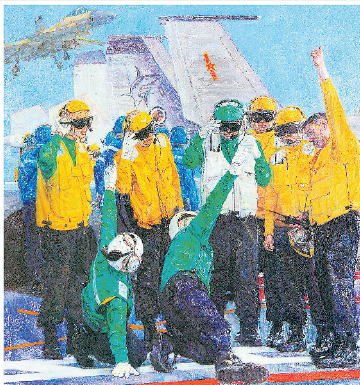
《起飞示意》油画 吴玉麟