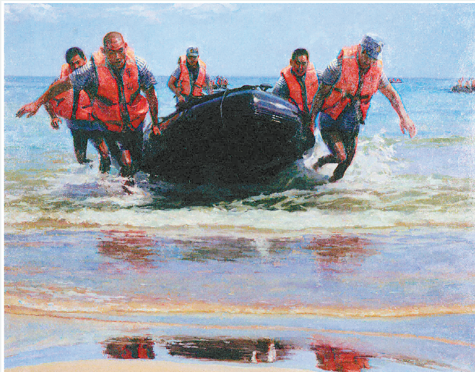
《抢滩登陆》油画 常进