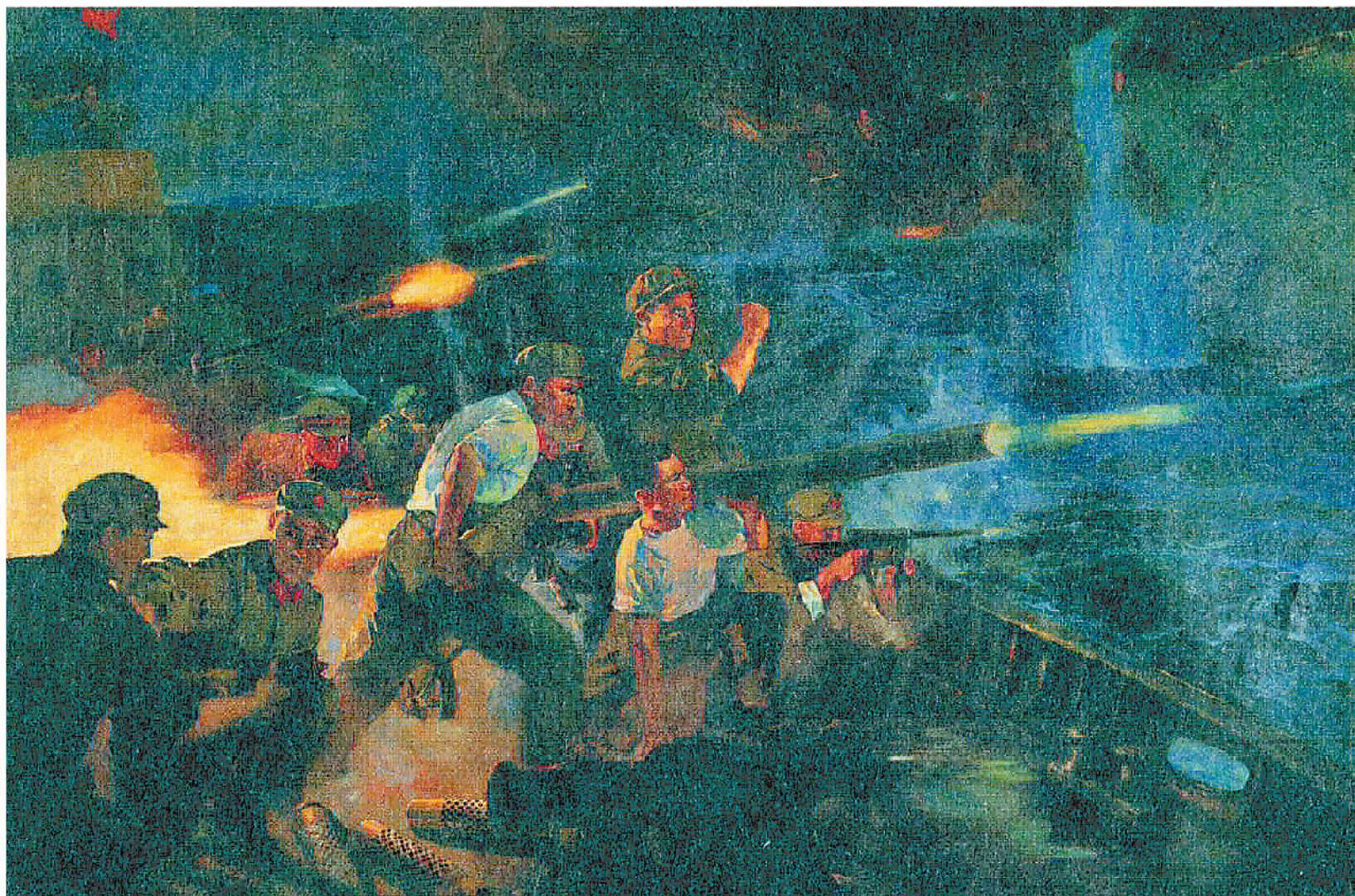
《首次海战》油画 艾民有

点评：1950年的万山群岛战役是人民海军的首次海战，也是人民海军和陆军首次协同作战。该画所描绘的正是我军不畏强敌、灵活机智、敢打必胜的战斗场景。画面着重突出此次海战的激烈氛围、我军的英勇无畏。作品以还原历史为主要任务，竭尽所能地去表现具体历史事件中的重要瞬间，保留这一时期的人物造型特征以及时代印记，画面中既有与战事相关的细节刻画，也有对海景的具体描绘，无论是大浪滔天还是炮弹落入海中溅起的冲天水柱，都充分还原了“首次海战”的真实场景。