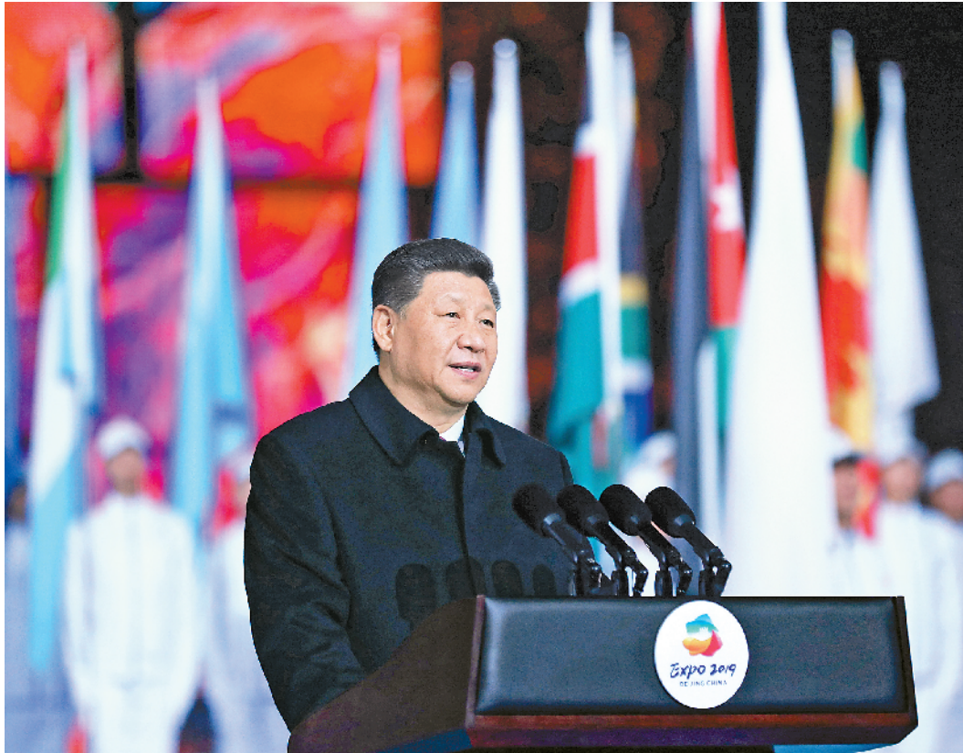
4月28日,国家主席习近平在北京延庆出席2019年中国北京世界园艺博览会开幕式,并发表题为《共谋绿色生活,共建美丽家园》的重要讲话。