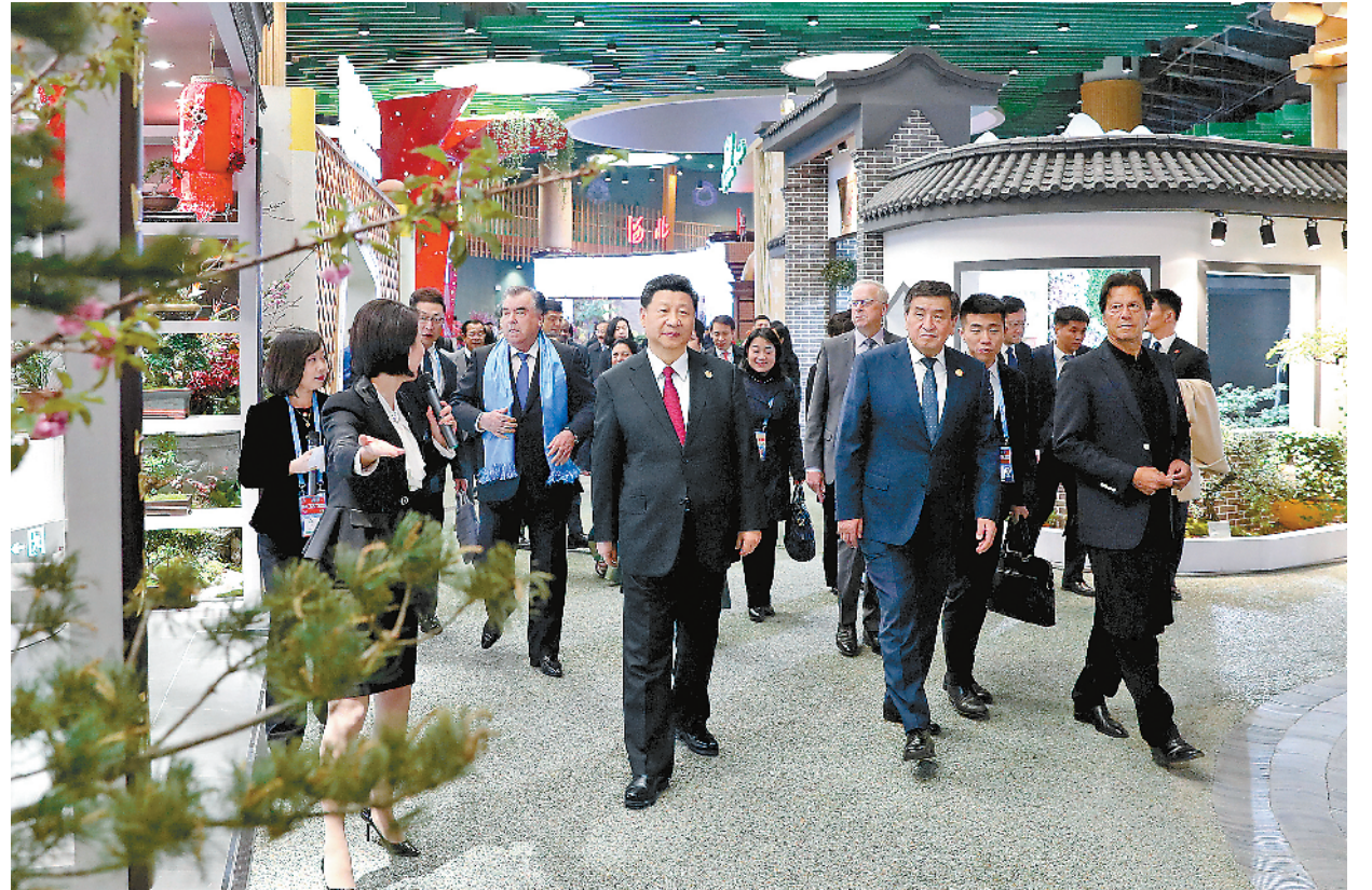
4月28日,国家主席习近平和夫人彭丽媛在北京延庆同出席2019年中国北京世界园艺博览会的外方领导人夫妇共同参观园艺展。

习近平强调,纵观人类文明发展史,生态兴则文明兴,生态衰则文明衰。杀鸡取卵、竭泽而渔的发展方式走到了尽头,顺应自然、保护生态的绿色发展昭示着未来。地球是全人类赖以生存的唯一家园。(下转第四版)