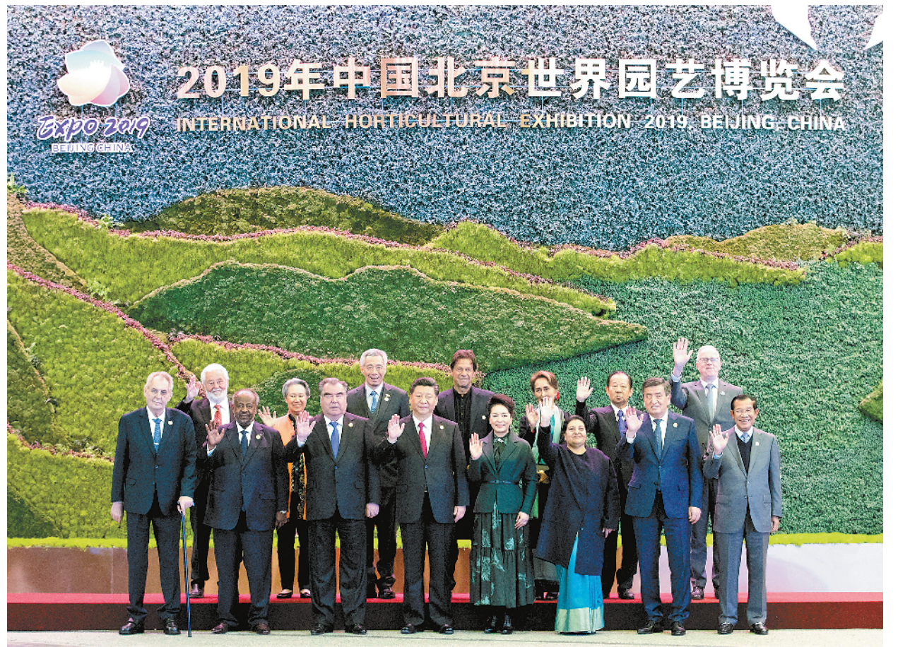
4月28日,国家主席习近平在北京延庆出席2019年中国北京世界园艺博览会开幕式,并发表题为《共谋绿色生活,共建美丽家园》的重要讲话。这是开幕式前,习近平和夫人彭丽媛同参加开幕式的外方领导人集体合影。