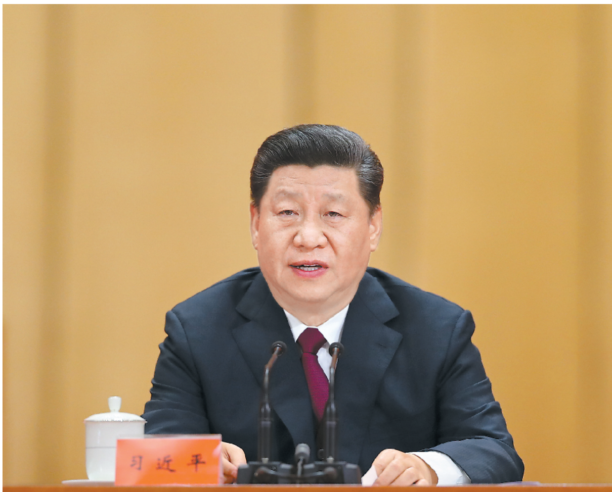
4月30日,纪念五四运动100周年大会在北京人民大会堂隆重举行。中共中央总书记、国家主席、中央军委主席习近平在大会上发表重要讲话。