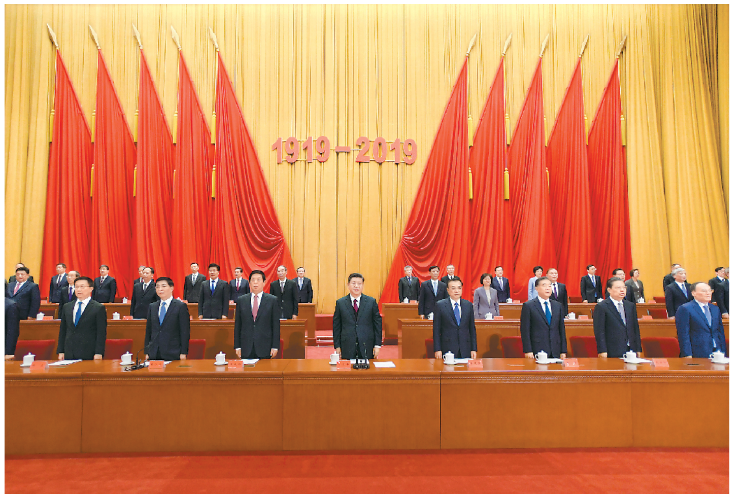
4月30日,纪念五四运动100周年大会在北京人民大会堂隆重举行。习近平、李克强、栗战书、汪洋、王沪宁、赵乐际、韩正、王岐山等出席大会。

新华社北京4月30日电 纪念五四运动100周年大会30日上午在北京人民大会堂隆重举行。中共中央总书记、国家主席、中央军委主席习近平在会上发表重要讲话强调,五四运动以来的100年,是中国青年一代又一代接续奋斗、凯歌前行的100年,是中国青年用青春之我创造青春之中国、青春之民族的100年。新时代中国青年运动的主题,新时代中国青年运动的方向,新时代中国青年的使命,就是坚持中国共产党领导,同人民一道,为实现“两个一百年”奋斗目标、实现中华民族伟大复兴的中国梦而奋斗。