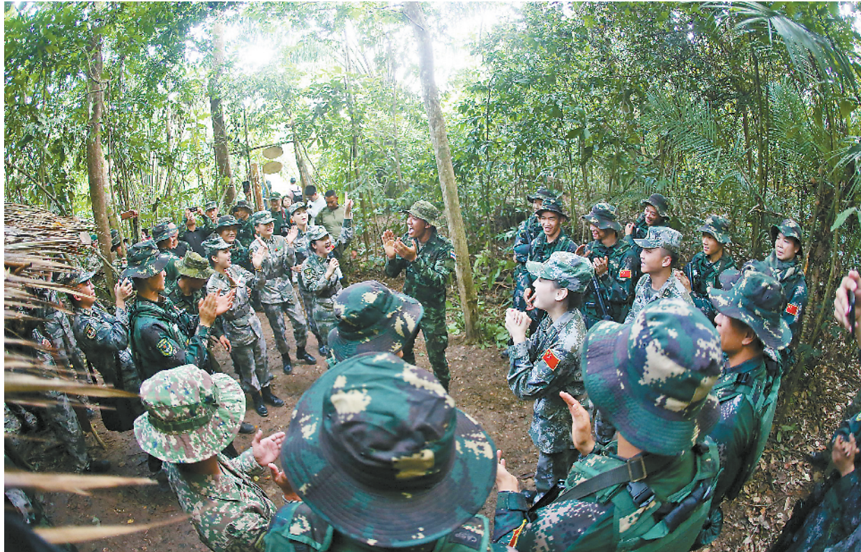
驻香港部队文工队矢志用精湛技艺和真情演出鼓舞官兵士气、传播中国文化。图为“和平友谊-2018”中马泰联合军演期间,他们来到丛林深处慰问演出。

作为文工队的一员,每个人都明白:为兵服务是自己的职责与使命。近年来,他们登海岛、赴营连,为官兵献上