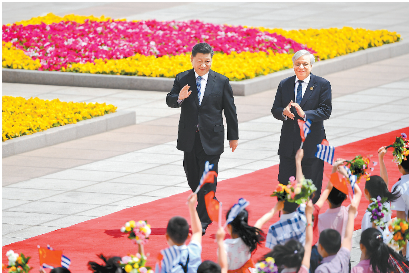
5月14日, 国家主席习近平在北京人民大会堂同希腊总统帕夫洛普洛斯举行会谈。这是会谈前, 习近平在人民大会堂东门外广场为帕夫洛普洛斯举行欢迎仪式。