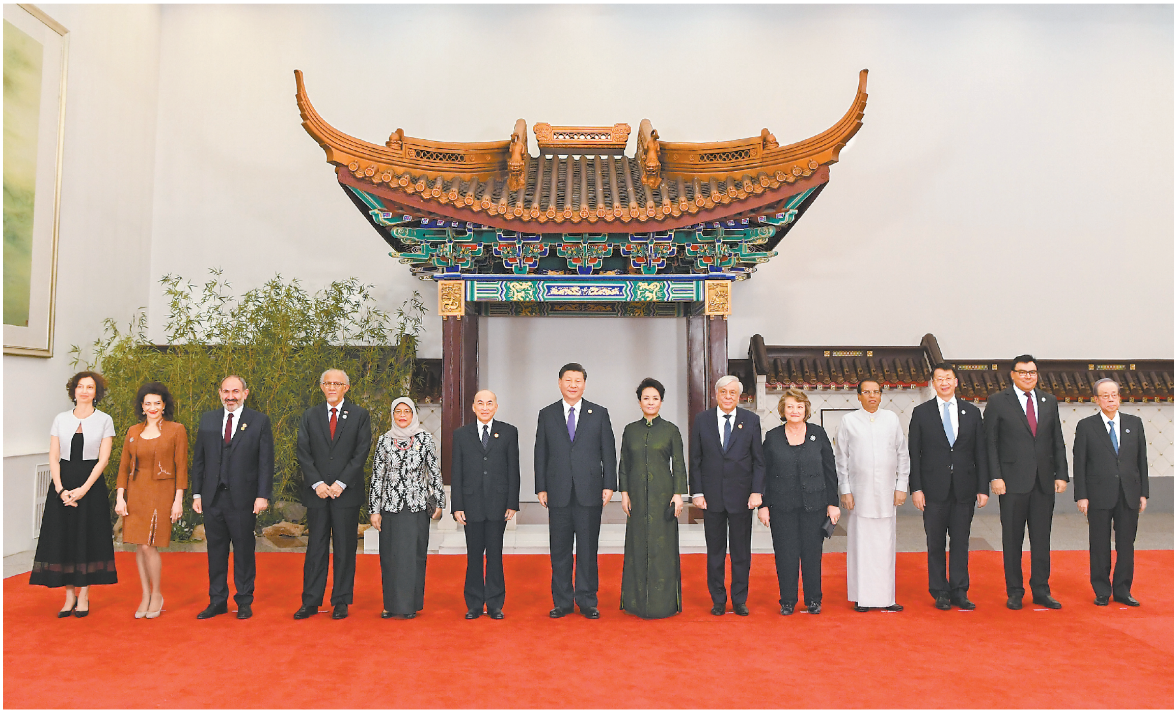
5月14日, 国家主席习近平和夫人彭丽媛在北京人民大会堂举行宴会, 欢迎出席亚洲文明对话大会的外方领导人夫妇及嘉宾。这是习近平和彭丽媛同外方领导人夫妇及嘉宾合影。