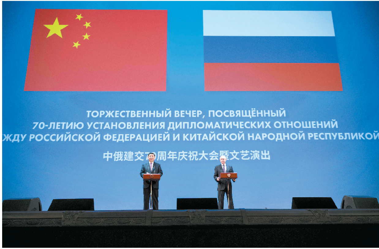
6月5日,国家主席习近平和俄罗斯总统普京在莫斯科大剧院共同出席中俄建交70周年纪念大会并观看文艺演出。

伟的目标。俄方愿同中方一道,为更好造福两国人民而共同努力。 在热烈掌声中,习近平发表题为《携手努力,并肩前行,开创新时代中俄关系的美好未来》的致辞。 习近平说,今天,我们隆重庆祝中俄建交70周年,共同迎来两国关系又一个历史性时刻。我们不会忘记,在艰苦卓绝的卫国战争和抗日战争期间,中苏军民并肩作战、共同抗击法西斯侵略,用鲜血铸就了牢不可破的战斗情谊。在中华人民共和国成立的第二天,苏联即承认并同新中国建立外交关系。在新中国建设百废待兴的岁月里,大批苏联专家用智慧和汗水帮助新中国奠定了工业化基础,也书就了中俄人民友谊的佳话。进入21世纪,双方签署具有里程碑意义的《中俄睦邻友好合作条约》。两国关系提升为全面战略协作伙伴关系,为推动建设新型国际关系、构建人类命运共同体树立了典范。 习近平强调,经过70年风云变幻考验,中俄关系愈加成熟、稳定、坚韧。我和普京总统宣布发展中俄