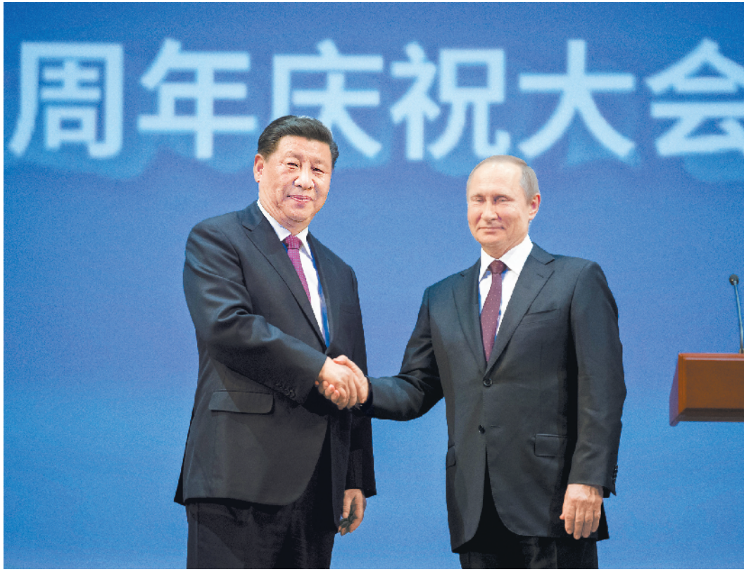
6月5日,国家主席习近平和俄罗斯总统普京在莫斯科大剧院共同出席中俄建交70周年纪念大会并观看文艺演出。

新华社莫斯科6月5日电 (记者陈贻、温馨、黄尹甲子)国家主席习近平5日和俄罗斯总统普京在莫斯科大剧院共同出席中俄建交70周年纪念大会并观看文艺演出。 夜幕下,位于莫斯科市中心的大剧院华灯闪烁、流光溢彩,洋溢着欢乐喜庆的气氛。 当地时间20时45分许,习近平和普京一同步入会场。全场起立,鼓掌欢迎。 普京首先致辞。他表示,建交70年来,俄中关系经历了不平凡的发展历程。双方相互支持和帮助,推动两国关系今天达到了历史最高水平。中国是俄罗斯最大的贸易伙伴,两国能源、航空航天、科技等领域合作成果丰硕。俄中两国密切协作,为维护国际和地区安全稳定、解决热点问题、应对人类面临的新挑战新威胁作出了重要贡献。俄中共同支持世界多极化,维护国际法及联合国宪章宗旨和原则,推动形成以平等互利、合作共赢原则为基础的国际新秩序。我同习近平主席今天共同签署并发表了联合声明,为俄中深化合作提出了更加宏