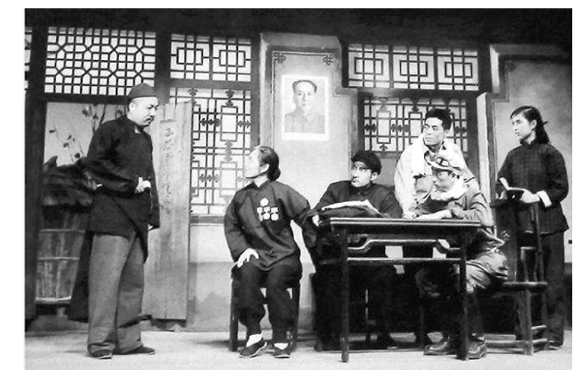
《槐树庄》剧照。该剧是胡可为纪念新中国成立10周年专门创作的,以土地改革和农村合作化为背景,讲述了几个农村人物的经历,在全社会产生热烈反响。