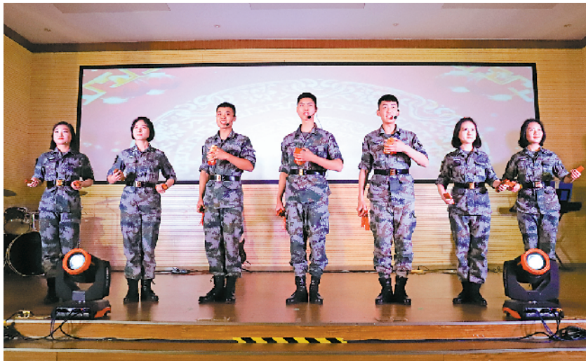
图为联勤保障部队郑州联保中心某部快板队正为官兵演出。

“创新,破除思想的屏障;创新,发展才有未来,胜利才有希望……”前不久,由联勤保障部队郑州联保中心某部4名战士编排的配乐诗朗诵《誓言有声》,作为中心“出彩联动人”颁奖晚会的压轴节目登台,将晚会气氛推上一个高潮。“真没想到我们部队的业余文艺骨干也能演得这么好!”台下官兵对该部文艺演出小分队给予赞誉和肯定。