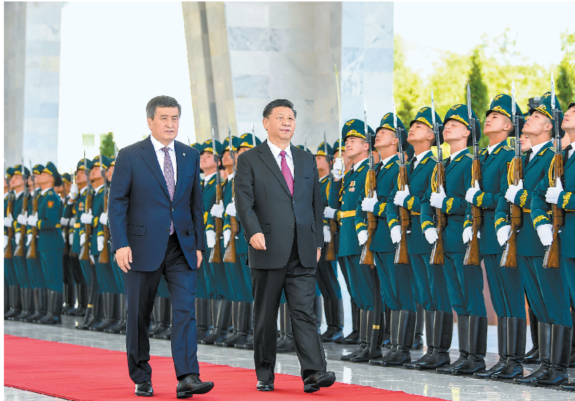
6月13日,国家主席习近平在比什凯克同吉尔吉斯斯坦总统热恩别科夫会谈。会谈前,热恩别科夫在阿拉尔恰国宾馆会议中心前广场为习近平举行隆重欢迎仪式。这是两国元首检阅仪仗队。