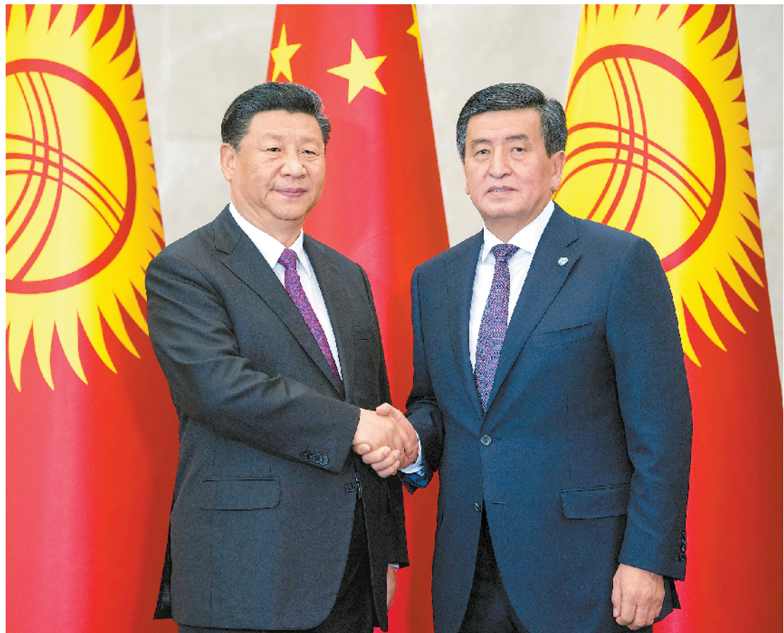
六月十三日,国家主席习近平在比什凯克同吉尔吉斯斯坦总统热恩别科夫会谈。