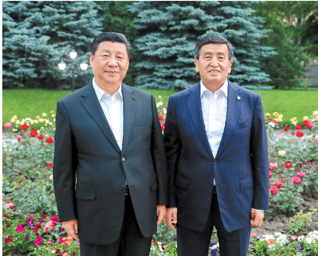
六月十二日,甫抵比什凯克的国家主席习近平,应吉尔吉斯斯坦总统热恩别科夫邀请,来到总统官邸。两国元首亲切会见。

习近平感谢热恩别科夫祝贺中华人民共和国成立70周年,指出在庆祝新中国成立70周年的时刻,中国共产党正在激励全党不忘初心,牢记使命。(下转第二版)