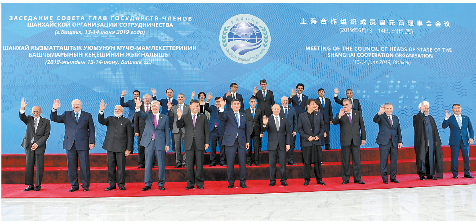
6月14日,上海合作组织成员国元首理事会第十九次会议在吉尔吉斯斯坦首都比什凯克举行。国家主席习近平同印度总理莫迪、哈萨克斯坦总统托卡耶夫、吉尔吉斯斯坦总统热恩别科夫、巴基斯坦总理伊姆兰·汗、俄罗斯总统普京、塔吉克斯坦总统拉赫蒙、乌兹别克斯坦总统米尔济约耶夫出席会议。习近平在会上发表重要讲话。这是大范围会谈后,与会各方集体合影。