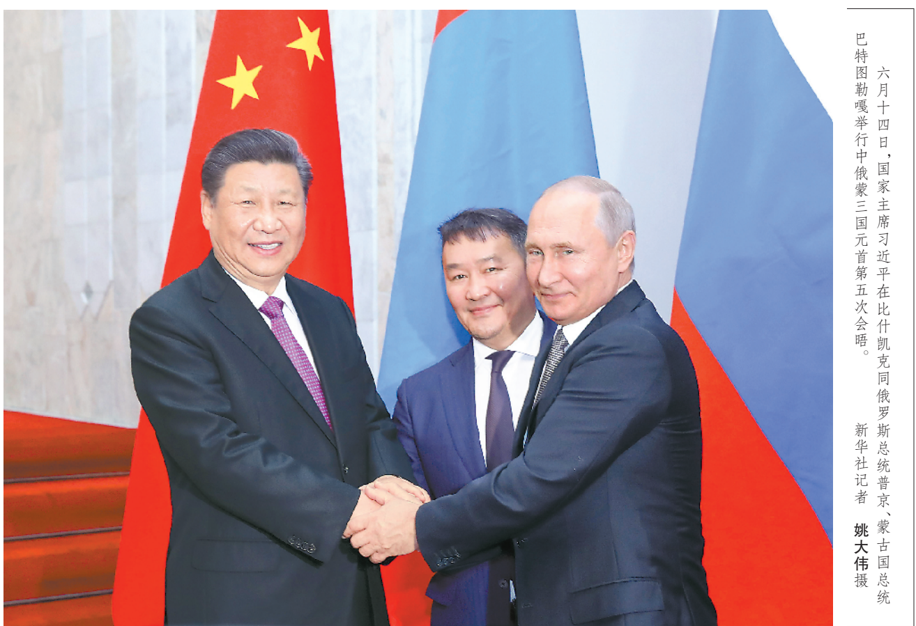
六月十四日,国家主席习近平在比什凯克同俄罗斯总统普京、蒙古国总统巴特图勒嘎举行中俄蒙三国元首第五次会晤。