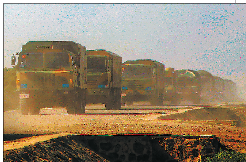
部队进行战场机动。 官兵夜间快速吊装导弹。

6月3日晚,华北某地域夜色如墨,万物沉寂。“呜——”一阵急促的警报声突然响起,正在驻训的南部战区空军地导某旅官兵闻令而动,奔向阵地。顷刻间,油机轰鸣、雷达飞旋、导弹昂首待发……一场夜间实战化防空演练拉开序幕。