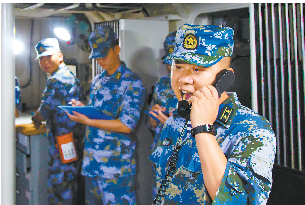
支队纪委派出监察组全程监督考核。