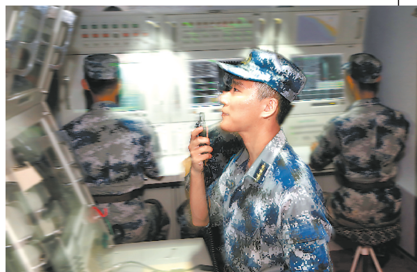
各战位官兵严阵以待。 导弹抗击来袭“敌”机。