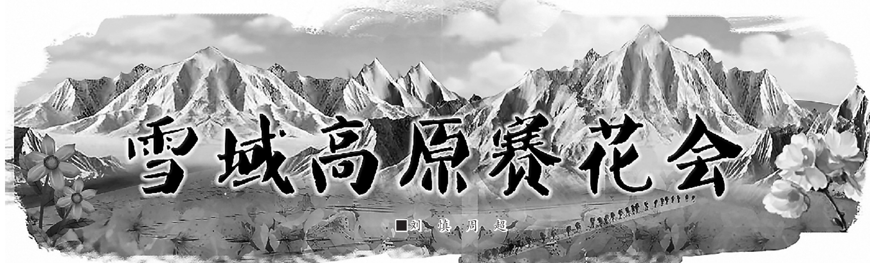
刘 旗 周 超