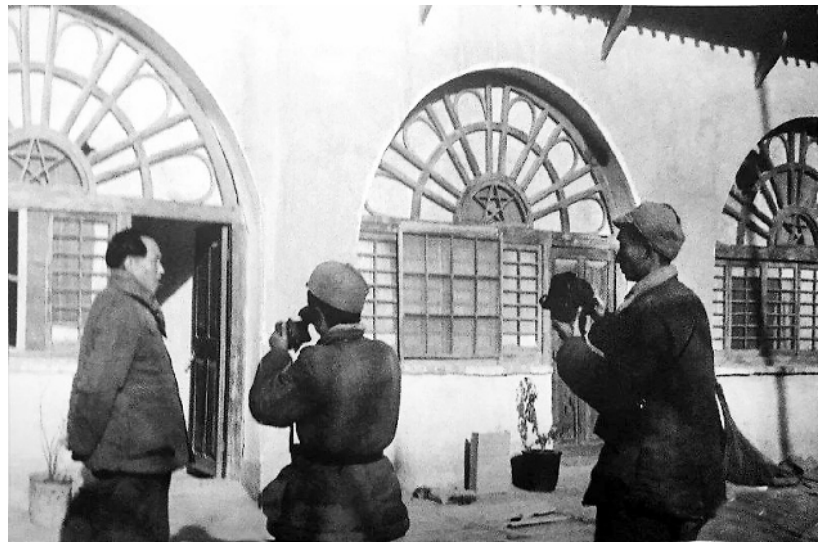
摄影队拍摄毛泽东主席。