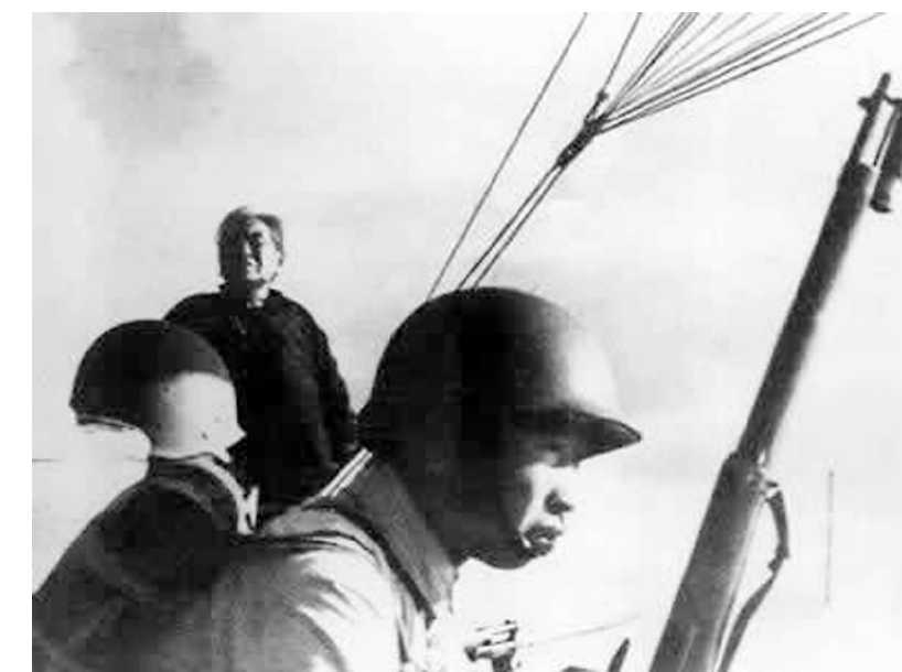
摄影师高振宗拍摄的渡江战役中的舵老大娘。

拍摄渡江战役分为9支摄影队，是投入最多、规模最大的一次，9名摄影师加上助手共23位小伙子参加了战地