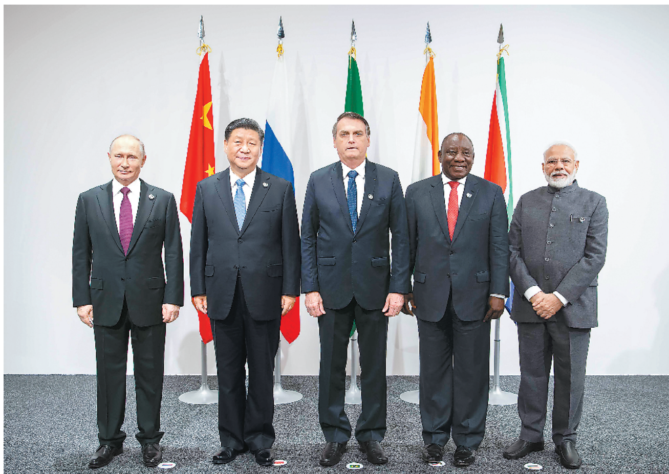
6月28日，金砖国家领导人会晤在大阪举行。国家主席习近平、巴西总统博索纳罗、俄罗斯总统普京、印度总理莫迪、南非总统拉马福萨出席。