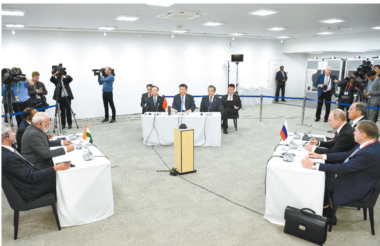
6月28日，国家主席习近平在大阪出席中俄印领导人会晤，同俄罗斯总统普京、印度总理莫迪就当前国际形势、重大国际和地区问题、三方合作深入交换意见。